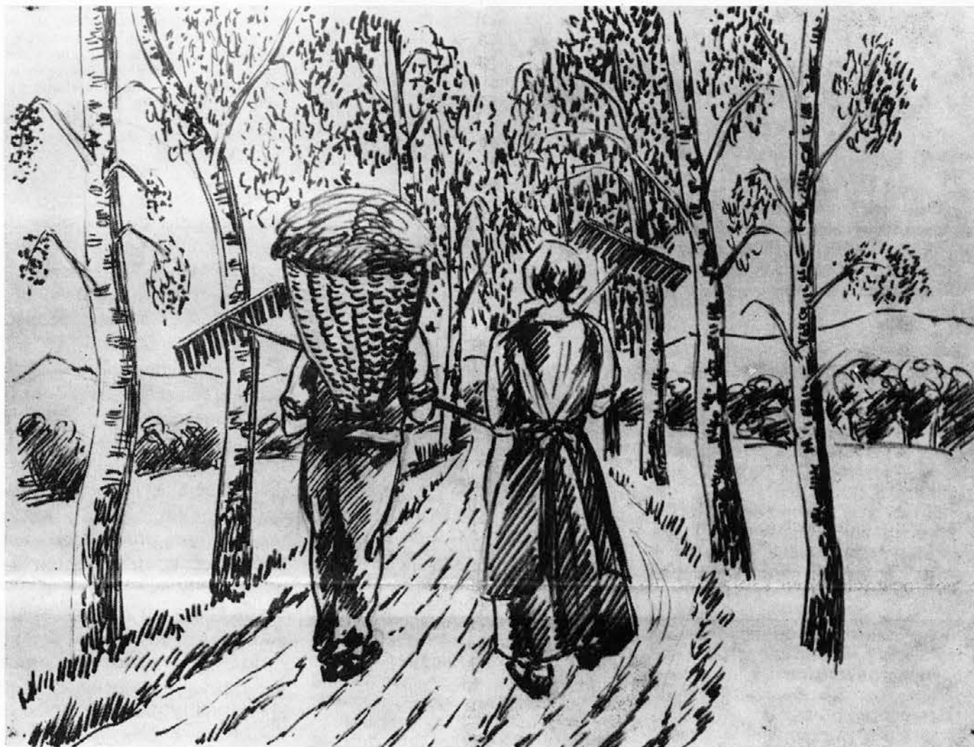
Motiv iz Furlanske Slovenije