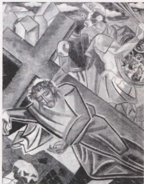
Gino Severini: VIA CRUCIS (II. postaja), Cortona, 1946