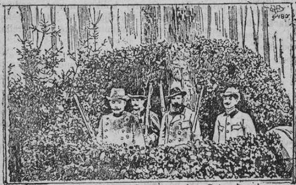
Erzherzog Franz Ferdinand auf der Jagd in Springe.

„Današnji shod protestira najodločneje proti zločinski prvaški obstrukciji v štajerskem deželnem zboru, katera je pahnila zgolj iz ničvrednih političnih vzrokov itak izmozgano ljudstvo v gospodarsko nevarnost. Shod upa, da bodejo delavoljne stranke to brezvestno obstrukcijo z najojstrejšimi sredstvi premagali. Slovenskim