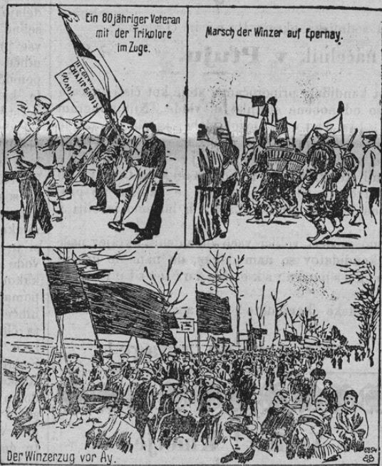
Der Aufstand der Champagne-Winzer.

Nekaj časa sem se pojavlja v vinorodnih krajih na Francoskem nezadovoljnost med tamošnjimi »viničarji«, na Francoskem imenujejo namreč »viničarje« kmete-vinogradnike same. Med temi kmeti se je pričela iz raznih gospodarskih vzrokov velika revščina. Vlada vzrok te revščine ni prav razumela; vstvarila je postave, ki so pa nezadovoljnost še hujše razširili. Sovražstvo kmetov se obrača zlasti proti velikim fabrikam šampanjca. Prišlo je najprej do velikih izgredov in naposled celo do krvavih bojev s priklicanim vojaštvom. Vojaštvo je zdaj sicer nasilstva omejilo. Ali revolucijski duh tli še vedno in vsak dan zopet zamore se pričakovati prelivanja krvi. Danes prinašamo nekaj slik iz teh krvavih kmetijskih uporov. Na prvi sliki vidimo zgorej v levem kotu nekega 80 letnega kmetjskega veterana, ki nosi zastavo upornikov. Na desni strani (zgoraj) vidimo uporne kmete, ki marširajo proti mestu Epernay. Spodaj vidimo uporne »viničarje« z orožjem in zastavami v bližini mesta Ay. Uporniki nastopajo seveda jako nasilno. Druga slika nam kaže razvaline fabrike za izdelovanje šampanjca, ki so jo uporniki v svoji besnosti zažgali. Ostalo je le še zidovje fabrike. V raznih krajih prišlo je že do krvavih spopadov med upornimi kmeti in vojaštvom. Uporniki gradijo barikaade in se branijo z orožjem. Kjerkoli zamorejo, uničujejo premoženje šampanjskih fabrikantov.