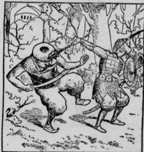
Kje je pa tretji Turek?