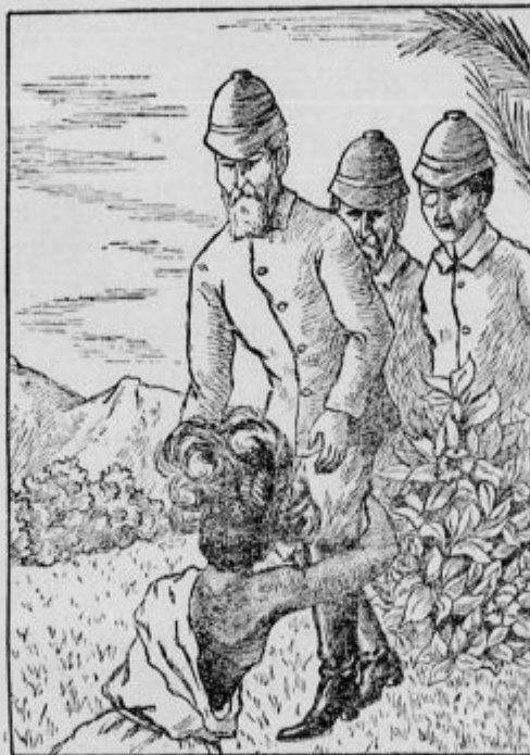
In stari vojak se je zgrudil pred nami in objemal Sergijeve kolena in glasno jokal od veselja.

Stesnil se je, napel in Sergij je bil zunaj, in ravno tako je bil Tomič in ravno tako sem bil jaz in visoko nad nami so svetile zvezde in v naših nosnicah je bil sladki zrak; nato pa se je nekaj udrlo in vsi trije smo se valili oko-