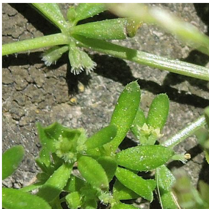
Slika 1: Galium murale – zalistna socvetja z drobnimi cvetovi

bodičk raskavo, zalistna socvetja so neopazna, s po nekaj cvetovi (Slika 1), ti imajo manj kot 1 mm širok rumenkast venec, ki hitro odpade, pecelj cveta se nato ukrivi navzdol, plodiča pa kmalu dozorita in se kot par klobas stikata le na dnu in na vrhu, dolga sta okoli 2 mm in gosto porasla s štrlečimi kljukastimi togimi dlakami (Slika 2).