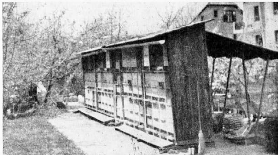
Zložljivi čebelnjaki za 24 AŽ-panjev so zelo praktični. Odlično nam služijo na pasiščih, v njih pa čebele tudi zelo dobro prezimijo

Zopet je sledila malo krajša, sicer pa nič milejša zima 1963—1964. Čebele niso izletavale celih 72 dni. Začetek februarja je v tem kraju zopet pokazal čebelarjem, ki ne verjamejo v čarovnije, kako so ga polomili, ker nas niso poslušali: že pred izletnimi dnevi so bila vsa žrela ponesnažena, prav tako tudi brade in čelne strani panjev. Mi pa smo imeli zdrave čebele, ki so se lepo otrebile in bili smo jih iz srca veseli.