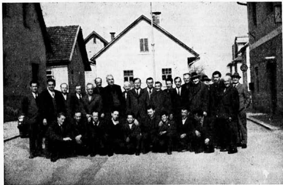
Kočevski čebelarji po ustanovitvi svojega društva