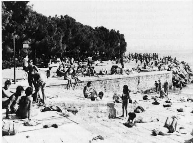
V vročih poletnih dneh so kopališča kot mravljišča

Okrog 23.30 smo se vrnili v Doberdolu. Romanje je potekalo v organizaciji agencije Quo Vadis iz Ljubljane z zelo dobrim vodičem. Organizatorji zaslužijo posebno pohvalo.