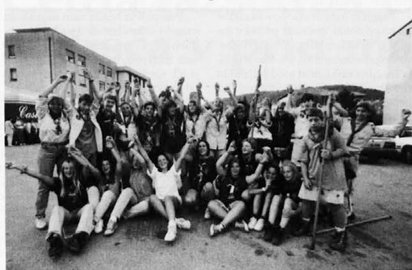
Skavtsko veselje ob povratku

V nedeljo, 30. julija, se je končal letošnji 4. slovenski zamejski jamboree, ki predstavlja enega viškov skavtskega delovanja. Od organizacije prejšnjega je sicer minilo že 11 let, pobudnica te velike manifestacije pa je Slovenska zamejska skavtska organizacija. Več kot 300 pripadnikov srednje starostne veje je postavilo šotore v Jablenci pri Čezsoči v bližini Bovca. Na jamboreju niso bili le skavtski vodi iz tržaške in goriške pokrajine ter Koroške, ampak tudi skupine iz Nove Gorice, Ankarana in Ljubljane.