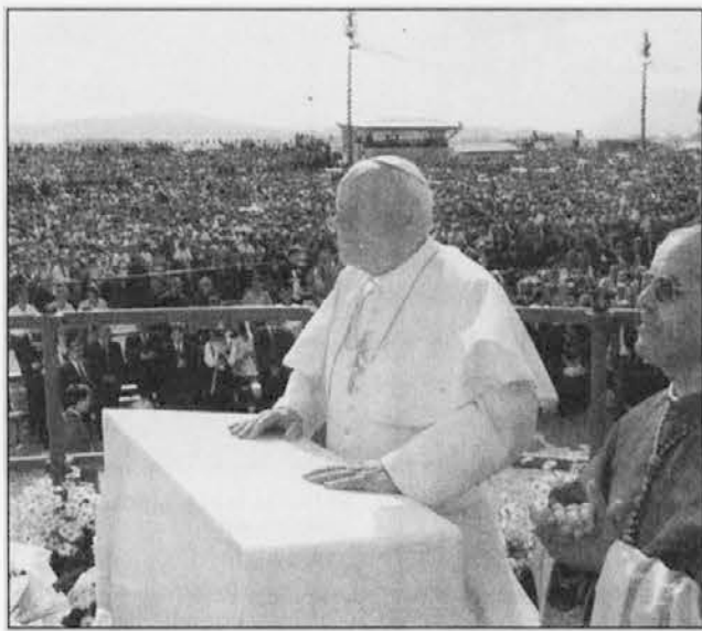
Janez Pavel II. med obiskom v Sloveniji maja 1996