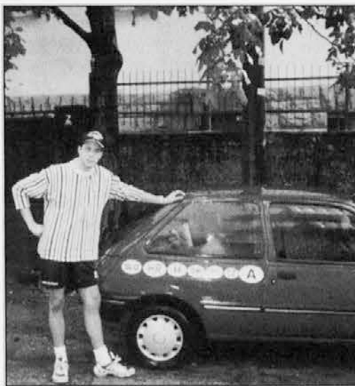
Srečna vrnitev domov

S postaje sva zapeljala proti meji z Italijo, ki jo lahko dandanes v schengenski dobi prečekaš s hitrostjo 100 ali več kilometrov na uro, tokrat pa so bili prav za mejno tablo, na kateri v krogu z dvanajstimi rumenimi zvezdicami piše Italia, na preži orožniki. Na srečo naju niso ustavili, tako da se je vožnja lahko