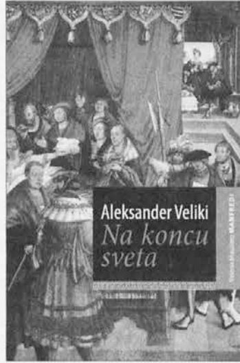
V prvi knjigi Sin sanj spremljamo Aleksandrovo otroštvo