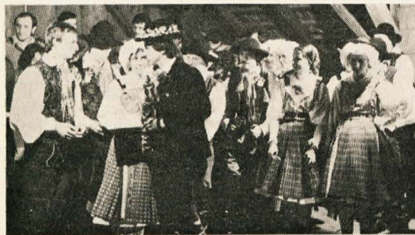
Akademska folklorna skupina „France Marolt“

skega običaja. Vendar je številno občinstvo, ki je napolnilo skedenj, imelo možnost prisluhniti zilijskemu narečju svatovalcev, katerih vloge so igrali domačini oz. igralci SPD „Zila“.