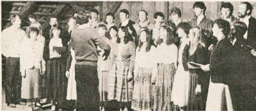
Mošani pevski zbor „Rož“ iz šentjakoba v Rožu

Prireditvev je bila načrtovana na Plicovem skednju, kar je „Uasciti prostem, žal pa je zaradi slabega pr Zile“ vzelo čar izvirnega od-vremena morala biti izvedena v igravanju nekdanjega ženitovanj-