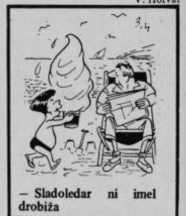
— Sladoledar ni imel drobiža