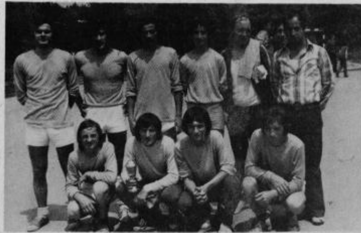
Zmagovalna ekipa iz Makol