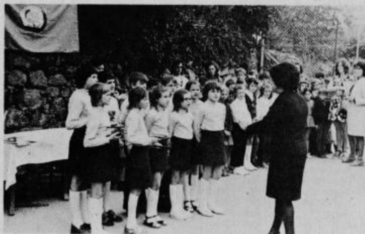
Ob zaključku letošnjega leta s pesmijo in spričevali