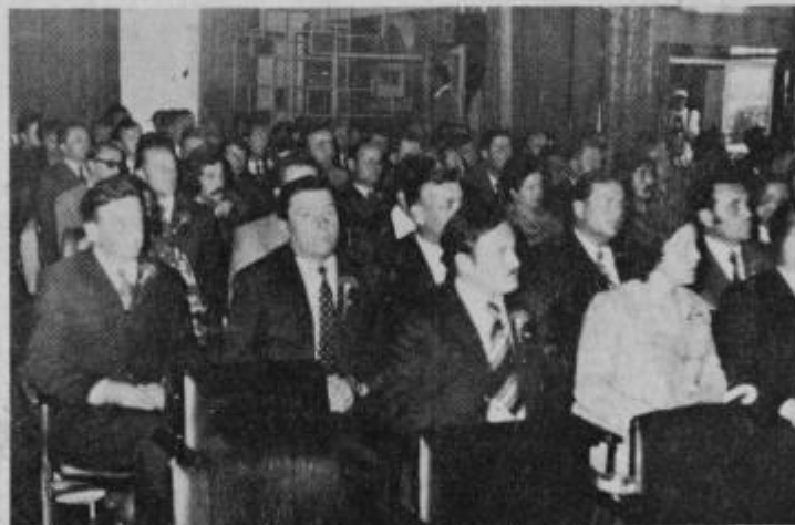
Udeleženci svečane seje minulo soboto v Čakovcu.

udeleženci seje ogledali kulturni del programa. Nastopilo je kulturno umetniško društvo „Vinko Zganec“ iz Vratišinca v občini Čakovec, nato so udeleženci obiskali muzej „Medžimurje“ in se v popoldanskih urah zadržali na tovariškem srečanju.