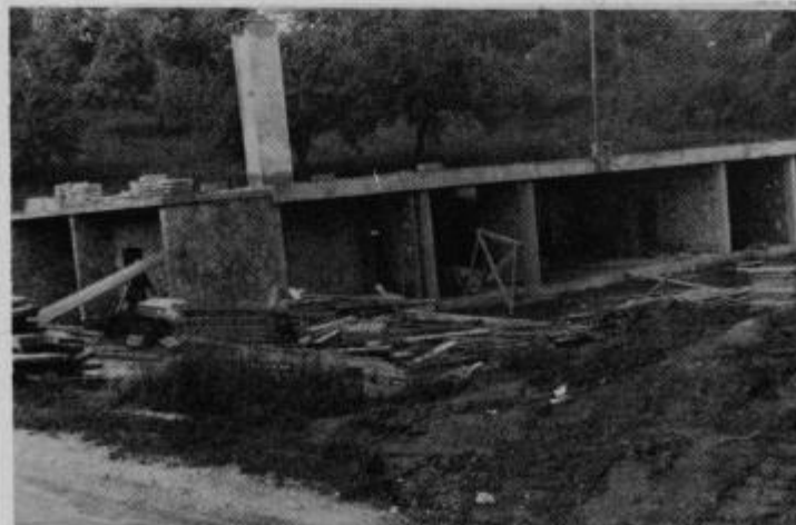
Še nekaj dni in na temeljih nove osnovne šole v Keblju bo mogoče videti montažni nadzidek in zunanjo podobo nove šole.