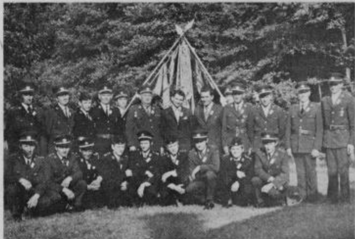
Gasilsko društvo Podgorci in Bresnica po slovesnosti