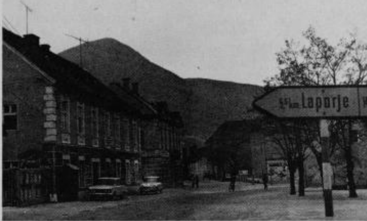
Središče Poljčan z Bočem v ozadju.

jev OF, ki je bil tudi osnova za organizirano odporiško gibanje skozi vse obdobje NOB na področju Poljčan in širše okolice z Bočem. Večina udeležencev prvega sestanka simpatizerjev OF je padla, ne uživajo tistega, za kar so se borili, a vendar ostajajo v srcih preživelih in tudi mlade generacije, ki so ji prav oni s svojimi življenji postavili temelje današnje samoupravne ureditve. Postali so njihov vzor in spodbuda v prizadevanjih za še boljše in uspešnejše uresničevanje ciljev, ki so jih v času NOB postavili borci za boljši jutri.