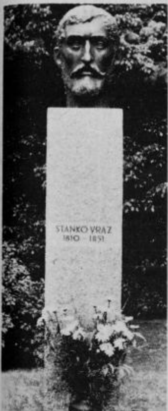
Spomenik Stanku Vrazu v ormoškem parku.

Naštevati bi lahko še in še. Tu so bile tudi druge kulturne, politične, kmetijske, športne, gasilske, in druge prireditve. Nekaj je ostalo trajnih, oziroma vsakoletnih in to je bil tudi eden izmed ciljev prireditev ob 700-letnici Ormoža.