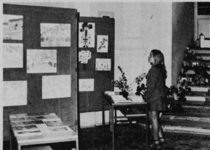
Del razstave, ki so jo ob koncu letošnjega šolskega leta pripravili učenci OŠ Ormož v avli svoje šole.

PIONIRSKA IN MLADINSKA ORGANIZACIJA sta pripravili novoletni kviz znanja. Tekmovali so učenci višje stopnje. Vprašanja so