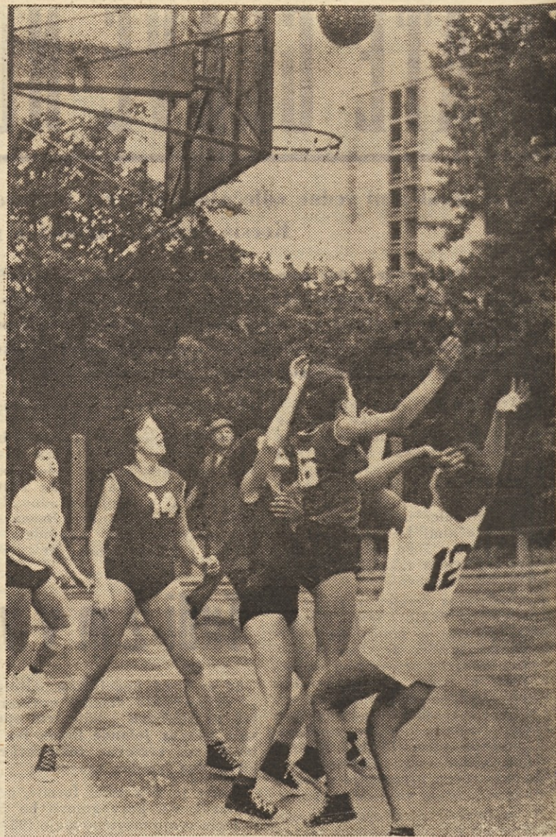
Skromna, a pomembna zmaga: prizor iz razburljive točke članic prve republiške košarkarske lige med Branikom in Jesenicami v Mariboru. V deževnem vremenu so bile domačinke boljše in so zmagale z 12:16