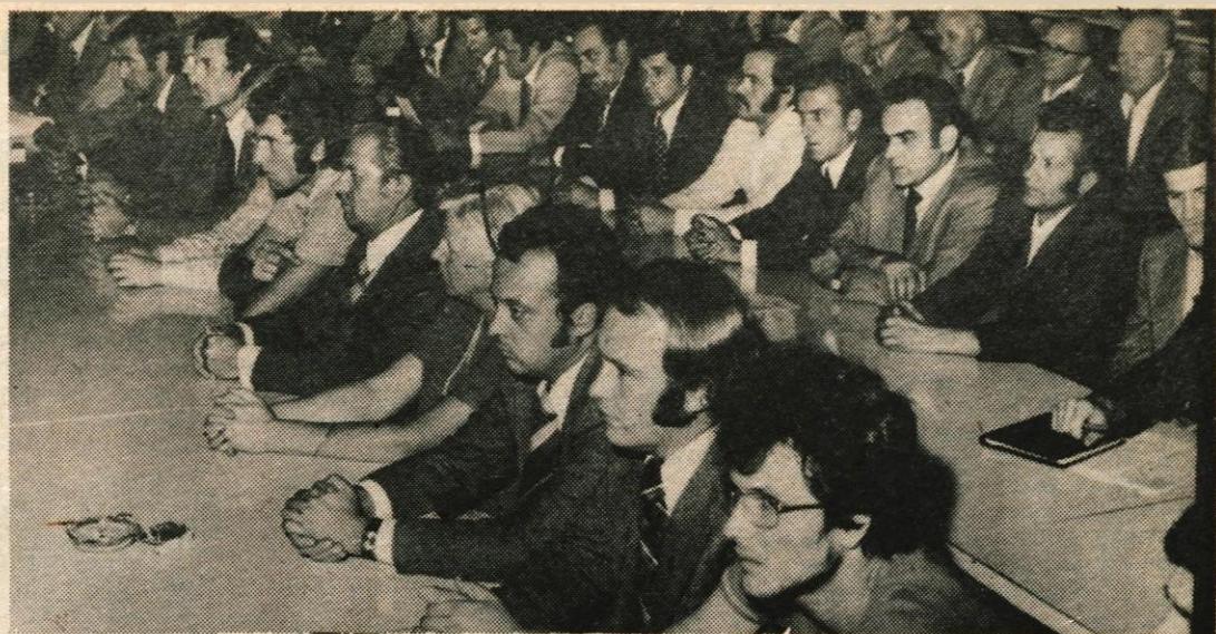
300 članov kolektiva ZP Iskra se je v četrtek popoldne zbralo v tovarni na Laborah. Na tribuni, ki jo je ljubljanska televizija posnela za oddajo Mi med seboj (na sporedu bo danes ob 20.05) je govoril in odgovarjal na vprašanja o dohodkih podpredsednik slovenskega izvršnega sveta Roman Albreht.