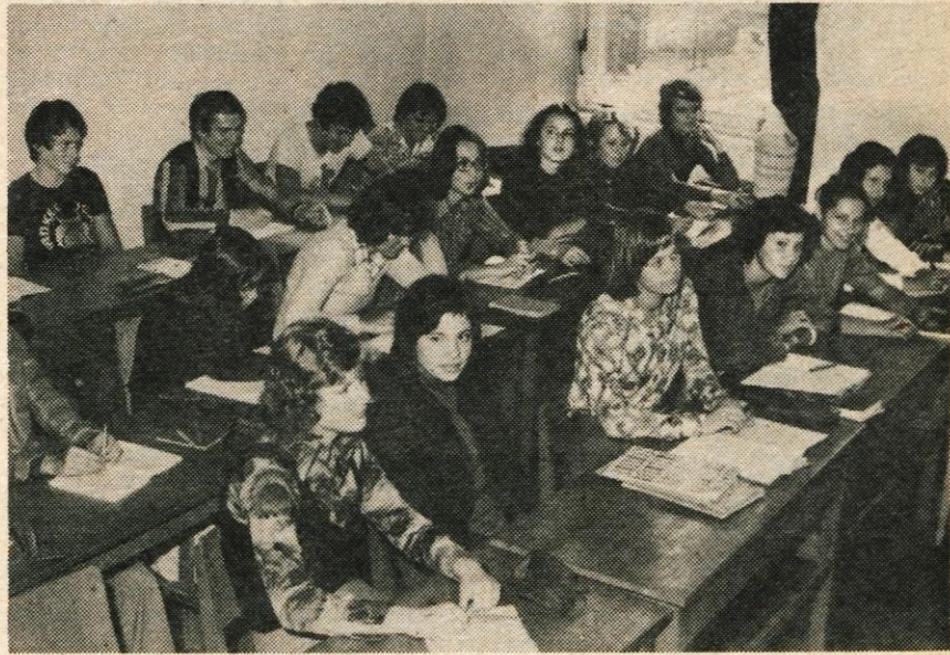
V tesnih učilnicah kranjske gimnazije se stiska tudi po petintrideset dijakov