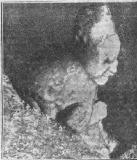
Škrat v Postojnski jami

Slikovita je pot iz stolnične dvorane s prostornino 40.000 m 3 v orjaško plesno dvorano, kjer je prostora za nad 20.000 oseb. Tukaj je bilo v mirnih časih za binkoščne praznike tradicionalno ljudsko veselje. Množice so rajale in se zabavale. Vstopiš v dvorano Božjega groba, potem skozi prostor, ki ima obliko prevrnjene ladje, v draguljno dvorano. Od tod nadaljuješ pot iz mavrične dvorane v prelesto gotško stolnico. Občuduješ znamenito koncertno dvorano, ki se lahko razkošno razsvetli in kjer so bile v predvojni letih izvajane številne znamenite skladbe pod vodstvom znanih glasbenikov. Tudi