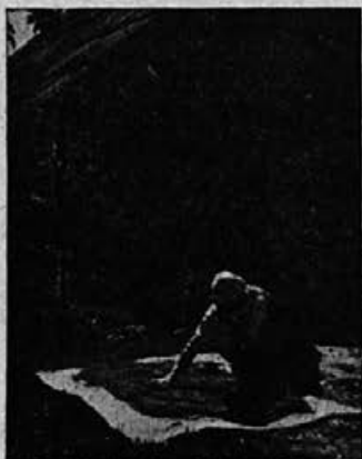
Fot. C. Švigelj

Počasi slači Mihevc suknič, pogovarjajoč se sam s seboj: „Ni bil slab dan. Vina do cementerenge zastonj, kozo na upanje —“