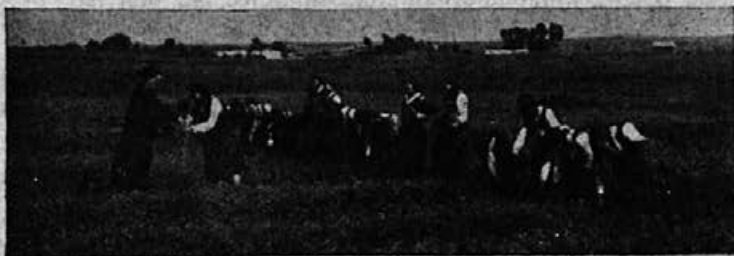
Kmetska dekleta pri delu

Pred vojno naša kmetijska mladina še ni poznala nobenih organizacijskih oblik in statotov, toda čutila je v sebi neodoljivo potrebo solidarnega ustvarjajočega dela kmetijskega ljudstva. To delo je bilo v začetku predvsem pro-