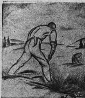
Kosci . . .

Ana je v strahu in veselju karala svojega moža: