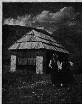
Proti domu . . .

„Kaj že spet počenjaš svoje norije! Vse kokoši in gosi bodo ponorele, da jih ne bo mogoče spraviti v staje!“