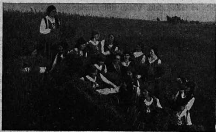
Kmetska dekleta na tečaju

Toda vsa ta vojna nasprotnikov kmetske mladine ni rodila zaželjenega uspeha. Nasprotno: vse, kar je še potrebovalo „pokroviteljev“, vse, kar še ni znalo stati samostojno na svojih nogah, kar še ni imelo svojega kmetskega jaza, je ostalo v rokah naših nasprotnikov. Oni, ki so popivali žganje po krčmah, se tam pretepali in si razbijali glave, ki niso bili veri „nevarni,“ so ostali neorganizirani. V organizacijah kmetske mladine so ostali samo samostojni, značajni, idejni ljudje, razumevajoči svoje poslanstvo v narodu. In čim več so imeli protivnikov, s tem večjo energijo so vršili svoje poslanstvo na sebi samem in na teh, katere je demagogija nasprotnikov kmetske ideje odtegnila njenim vrstam.