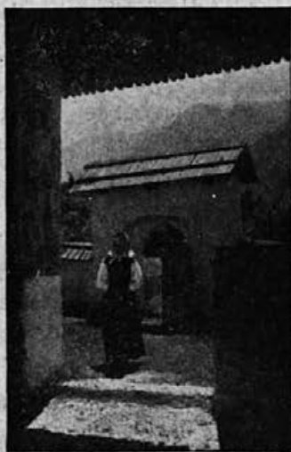
K službi božji