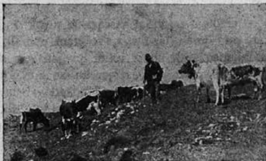
Življenje na planinah

Hrano smo imeli dobro. Nikdar preje ne pozneje take. Večkrat smo imeli za večerjo pečenko in te toliko, da nam je ostajala. Poleg so nam dali še priboljšek. Kruha smo prejeli eno kilo na moža, in to dobrega kruha iz najboljše moke, zraven pa še pol litra vina. Dva meseca v Rivi, to je bilo najlepše vojaško življenje in prepričan sem, da bi ga vsakdo radovoljno zamenjal z današnjim.