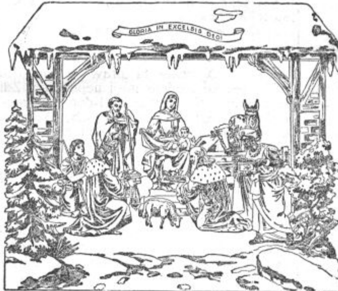
Mir ljudem na zemlji...

Najzvestejši Tvoji prijatelji smo, že od vsega začetka verujemo v Tvojo pravičnost in