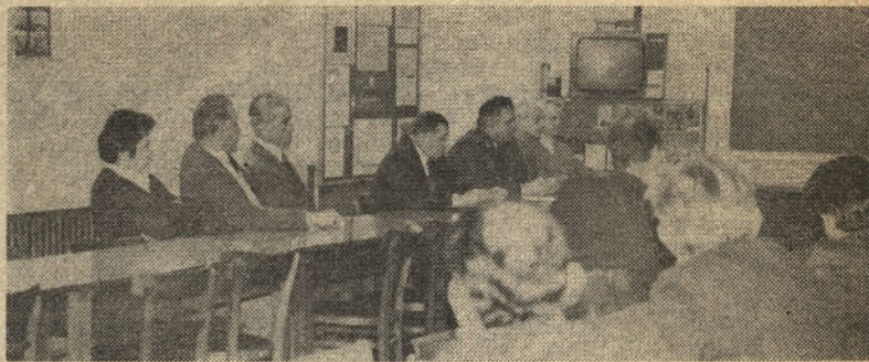
Srečanje gasilcev Slovenskih železarn v Štorah