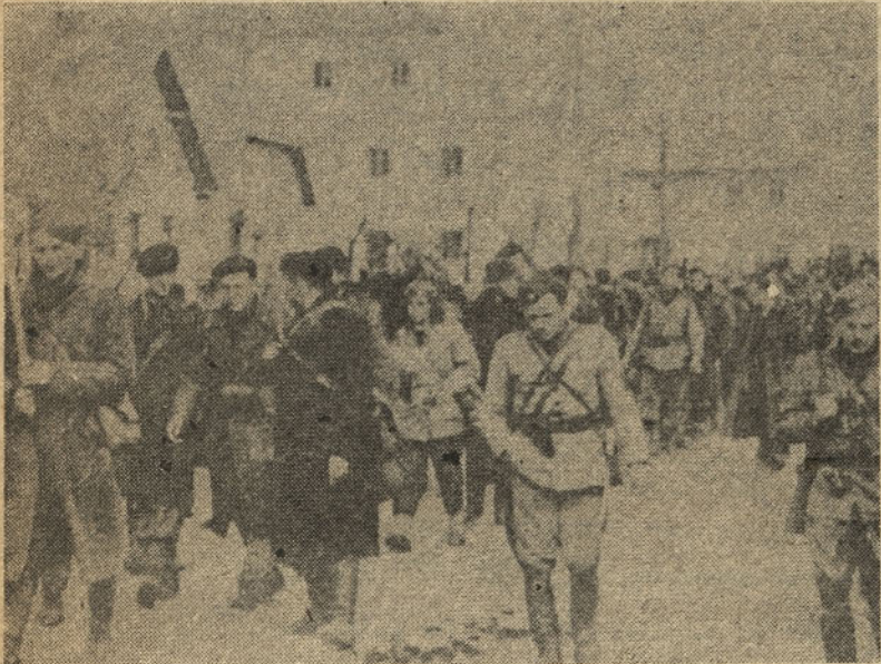
Štirinajsta divizija na pohodu na Štajersko v Čazmi 17. januarja 1944