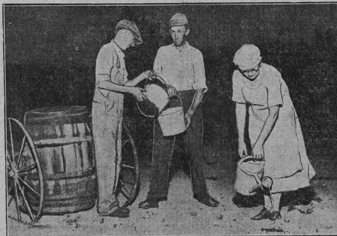
Slika je bila vzeta v Menominee, Wis., v središču krajev, ki jih je pritisnila letošnja suša, in kaže, kako se dragocena voda razdeljuje med tamkajšnje prebivalstvo. O kakem zalivanju vrtov v teh krajih ni bilo govora.