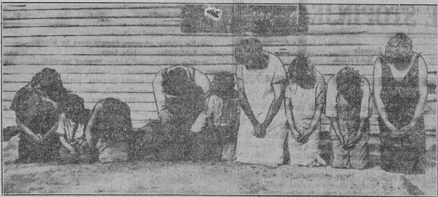
V obupu se je prebivalstvo krajev, prizadetih od suše, obrnilo k zadnjemu upanju, k molitvi. Slika kaže neko celo družino v Menominee, Wis., ki je pred hišo na prostem pokleknila k molitvi za dež.