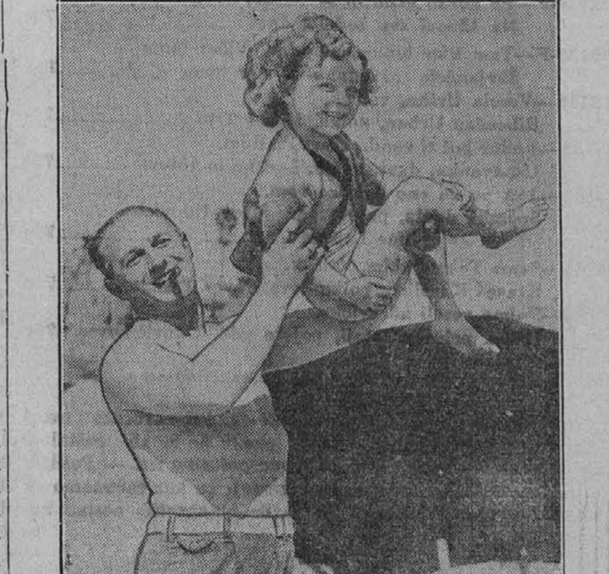
Pet let stara Shirley Temple, ki že uživa sloves filmske zvezde. Kljub temu pa se pri papanu počuti še najbolj zadovoljno.