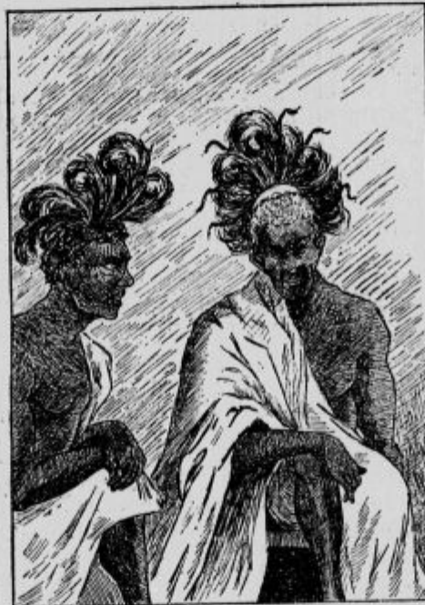
Kmalu sta prišla Infadus in kraljevi sin, se vsedla na majhne stolčke in sta nam delala družbo pri pojedini.

Kmalu smo začeli zunaj glasove, in ko smo stopili k vratom, smo ugedali celo vrsto gospodičen, ki so nosile mleko in pečene močnate jedi ter med v posodah. Za njimi je stalo nekoliko mladeničev, ki so gnali debelega mladega vola. Sprejeli smo te darove in