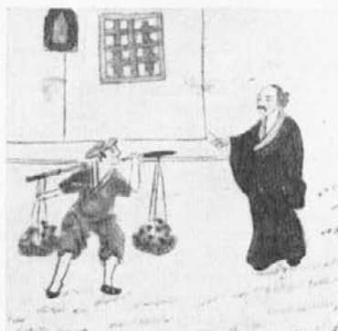
Risarske umetniše kitajskih šolarjev.