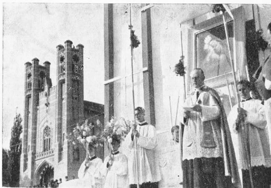
Pred Marijo Pomagaj na Rakovniku 29. maja 1943

Da bi ostali stanovitni, to se pravi, da bi se res vsak trenutek Bogu darovali z vsem svojim življenjem in da ne bi na prvo posvetitev pozabili, nam škof istočasno naroča novo vrsto prvih sobot in pa družinske posvetitve.