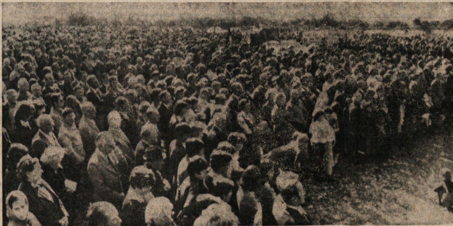
Večisočglava množica se je večer popoldne zbrala na protestnem shodu pred oskrunjenim spomenikom bazovskim junakom

BAZOVICA — «Kot izraz vse demokratične javnosti, vseh struk in organizacij, ki se sklicujejo na svetle ideale osvobodilnega boja...»