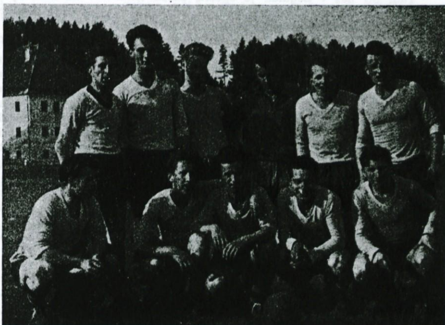
Nogometno moštvo TVD »Partizan« Dol. Logatec leta 1956

komu je ta iniciativa služila in kdo so bili voditelji telovadečih vrst. Prav to, da je telovadba vezala ljudi raznih položajev in raznih strank, ki so med seboj tekmovali v uspehih, vezale na sebe ljudi, ki so morali delovati v teh organizacijah, če so hoteli služiti kruh, vzgoja mladine v duhu teh strank, je osnova uspehov takratnega »Sokola« in še drugih podobnih organizacij in društev. Veliko število vodilnih oseb še danes nudi pomoč, če ne aktivno v vaditeljskih vrstah, pa vsaj z nasveti. Nekdanja društva razen telovadbe niso poznala drugih načinov krepitve telesa.