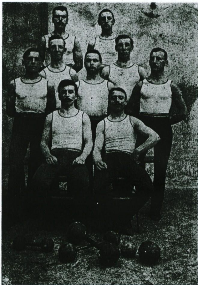
Telovadci bivšega Sokola v Logatcu .