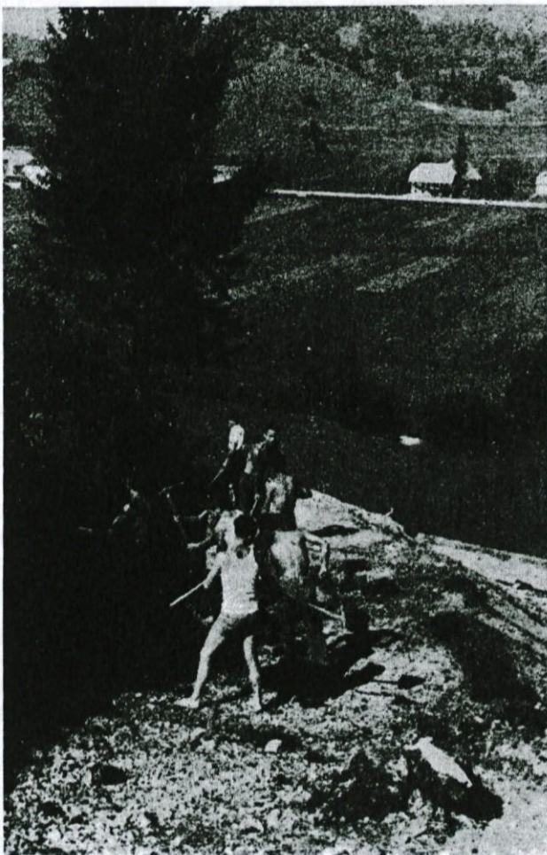
Gradnja nove skakalnice

Da, odločili so se. Dolgoletna želja vseh smučarjev v Logatcu, da bi dobili večjo skakalnico, se je uresničila. Njihov predlog je bil na seji odbora TVD »Partizan« Dolenji Logatec navdušeno sprejet. Načrte so že imeli v rokah, ko so odbornike postavili pred dejstvo: »Začnimo graditi ali pa propade načrti!« Tudi predsednik ObLO Logatec, tov. Petkovšek, se je za novo gradnjo ogrel. Vse potrebno nam je preskrbel. Povedal nam je tudi kako bi prišli do denarja. Kako smo prišli do njega, pa vidite danes, ko berete Logaške novice. Poglejte na oglasne strani. Tu je denar, tu so sredstva iz katerih gradimo našo »velikanko«. Seveda je organizacija posegla še drugam. Predstavniki logaških podjetij so nas na seji prijetno presenetili. Vsako podjetje je ponudilo znatno pomoč z delovno silo ali pa z gradbenim materialom. Pripravljalni odbor je začel s polno paro. Delavci, ki jih je plačala Kmetijska zadruga Dolenji Logatec, »Hrušica«, Trgovsko podjetje Logatec, Vodovod, Komunala ObLO, Gradbeno podjetje in tovarna KLI Logatec, so začeli z delom. Prav v največji delovni vnemi pa se je pripetila katastrofa. Zgorela je tovarna KLI, ki je prevzela najtežji del izkopa. Vsi so že mislili, da bo konec z gradnjo skakalnice. Res je tudi tako kazalo. Toda odločnost