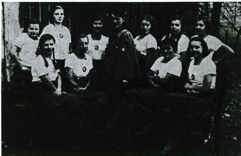
Naraščaj Sokola v Logatcu leta 1937