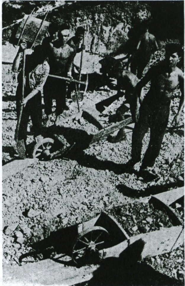
Udarniki pri delu na odskočni mizi

predsednika »Partizana« in ohrabrujoče besede tovariša Petkovška so pripomogle, da se je skakalnica gradila nemoteno naprej. Po načrtu tov. Bloudka so se že začeli kazati obrisi njegove mojstrovine. Danes se zemeljska dela že bližajo koncu. Skakalnica dobiva svojo obliko. Treba je zgraditi le še umeten nalet, ki bo segal do vrha Sekirice, sodniški stolp in še nekaj olepševalnih del, pa bo skakalnica pripravljena za otvoritev. Na njej dela vsako nedeljo lepo število udarnikov, predvsem številni mladinci iz vaješke šole v Gorenjem Logatcu. Zato pa je udeležba domačih članov »Partizana« iz Gorenjega in Dolenjega Logatca manjša. Graditev skakalnice ne bo koristila le posameznikom in tistim, ki vodijo gradnjo, pač pa vsem športnikom in prebivalcem Logatca, ker bodo zimski nastopi smučarjev prinesli veliko zabave, pospeševali razvoj turizma in tudi finančni uspeh ne bo izostal. Z dograditvijo skakalnice bomo imeli možnost prirejati skakalne tekme Ljubljanske smučarske podzveze, morda pa celo republiška in državna prvenstva. Logatec je znan po ugodnih snežnih razmerah. Nekdaj je v Logatec prihajalo veliko smučarjev iz bližnje Primorske in Ljubljane. Danes je naš kraj malo znan, čeprav ima lepše terene kakor Pokljuka in ne slabše od Kranjske gore. Zveze z vlaki in avtobusi so za smučarje idealne. Ko bodo spoznali vse ugodnosti, potem se nam ne bo treba bati, da bodo naša smučišča prazna.