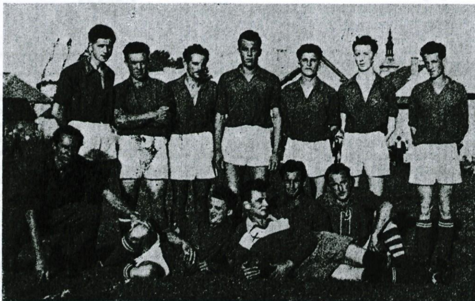
Nogometno moštvo TVD »Partizan« Dol. Logatec leta 1951