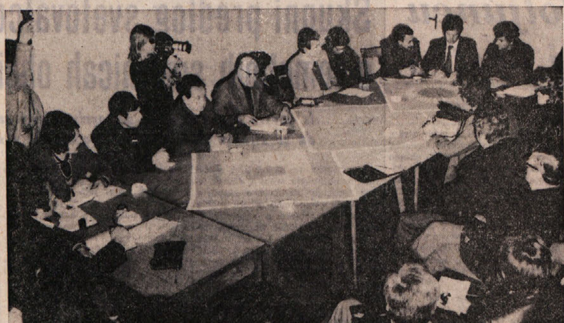
V četrtek zvečer je bilo v prostorih PD Igo Gruden v Nabrežini posvetovanje predstavnikov prosvetnih društev s Tržaškega in Goriškega, ki so včlanjena v SPZ. (Gornja slika). PD »Rdeča zvezda« in SK »Kras« sta priredili Prešernovo proslavo v turek v Zgoniku, dan prej v Briščikih. Nastopil je tudi oktet »Majnica«.