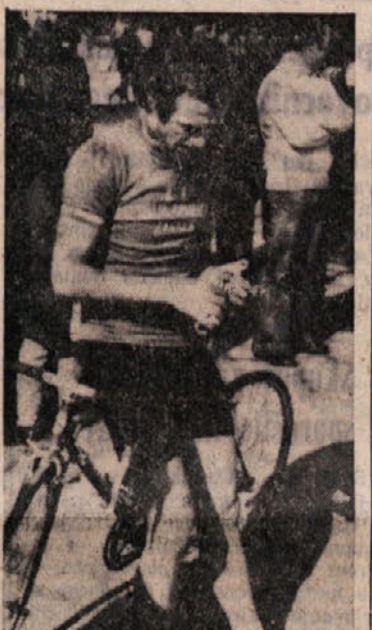
Med tistimi, ki se bodo udeležili...