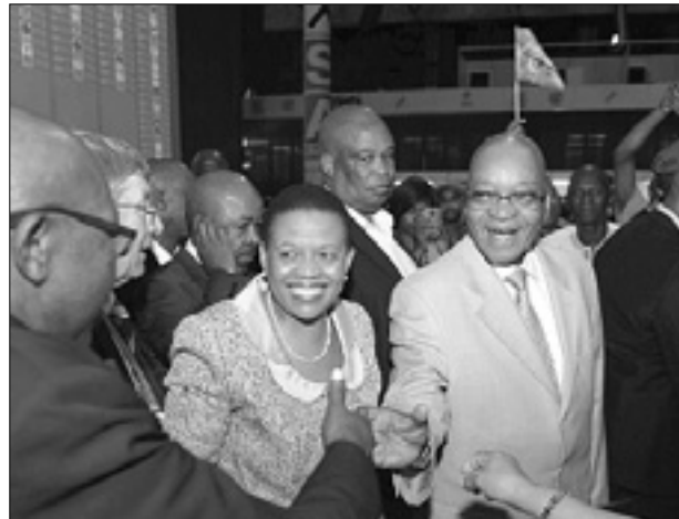
Levo sedanjí predsednik države Jacob Zuma (ANC) s soprogo, spodaj njegova izzivalka Helen Zille (DA) (v sredini), desno plesi ob proslavi obletnice prvih svobodnih volitev v Južni Afriki