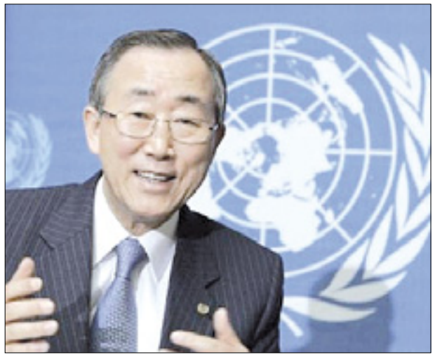
Generalni sekretar Združenih narodov Ban Ki Moon

NEW YORK - Generalni sekretar ZN Ban Ki Moon je ob svetovnem dnevu svobode medijev pozval k več varnosti za novinarje. V zadnjem letu dni je bilo ubitih 70 novinarjev, 14 jih je zaradi svojega dela umrlo letos. Ban je tako vlade kot posameznike pozval, naj aktivno branijo pravico do svobode medijev. »Vsako leto ob dnevu svobode medijev potrdimo našo zavezo temeljni svobodi prejemanja in razširjanja informacij in idej skozi medije, ne glede na meje, kot je zapisano v 19. členu univerzalne deklaracije človekovih pravic. A vsak dan v letu vidimo napade na to pravico,« je v poslanici zapisal Ban. Lani se je za zapahi znašlo 211 novinarjev. Od leta 2008 jih je moralo 456 zapustiti svojo državo. Od leta 1992 je bilo ubitih več kot 1000 novinarjev, kar je skoraj eden vsak teden. »To so alarmantne številke,« je opozoril Ban in poz-