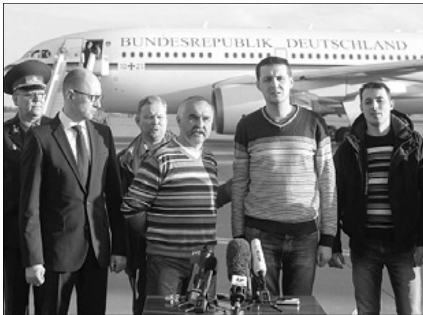
Osvobojene opazovalce Ovseja je na letališču v Kijevu sprejel premier Jacenjuk

O krizi v Ukrajini sta po telefonu znova govorila tudi ameriški državni sekretar John Kerry in ruski zunanji minister Sergej Lavrov. Kerry je ob tem pozval Rusijo, naj preneha podpirati proruske separatiste v Ukrajini. Lavrov pa je pozval ZDA, naj pritisnejo na ukrajinske oblasti, da bodo končale vojaško operacijo na vzhodu Ukrajine. (STA)