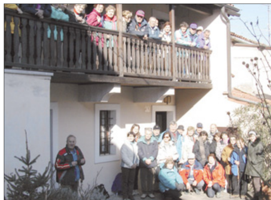
Na sliki zgoraj utrinek z izleta po tržaški okolici pri Banih leta 2002; spodaj skupinska slika učiteljev smučanja

Slovensko planinsko društvo Trst, tako se je društvo preimenovalo leta