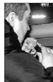
Voznik je »pihal«

Preizkus alkoholiziranosti je potrdil, da je moški, preden je sedel za volan, globoko pogledal v kozarec. Rezultat alkotesta je namreč pokazal preko 2,4 grama alkohola v litru krvi, kar je zelo visoka stopnja alkoholiziranosti, saj je dovoljeni prag 0,5 grama v litru krvi. Na podlagi 186. člena prometnega zakonika so karabinjerji moškemu takoj odvzeli voziško dovoljenje (zaradi kršitve bo izgubil deset točk), ob tem pa so mu tudi zasegli avtomobil. Ne nazadnje so moškega, ki ga ob naštetem čaka zelo slana denarna kazen, prijavili na prostosti goriškemu tožilstvu zaradi vožnje pod vplivom alkohola.