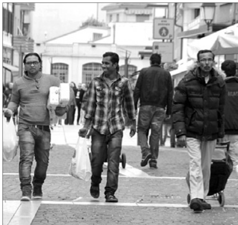
V tržiški Ulici Sant'Amrogio

Med najbolj zastopanimi državami sta Albanija in Ukrajina. Levji delež ukrajinske skupnosti predstavljajo ženske, ki so v Tržiču zaposlene kot družinske negovalke. Večina moških priseljencev pa se zaposli pri podjetjih, ki izvajajo podizvajalska dela v ladjedelnici. Družba Fincantieri ima okrog 1700 delavcev, okrog tri tisoč pa je zaposlenih pri podizvajalcih, ki jih je preko 300. Tudi v tem sektorju je kriza imela hude posledice: od decembra so denimo vključili v program mobilnosti 47 delavcev podjetja Eurogroup in okrog 30 delavcev podjetja Beraud Mare, v še slabšem položaju pa je 40 delavcev podizvajalskih podjetij ISO.C in SCE, ki sta bili vpleteni v preiskavo o izkoriščanju delavcev »Freework 2«. Namesto njih so v Tržič prišli delat delavci druge družbe iz Neaplja, ki so ji zaupali nekaj podizvajalskih del.