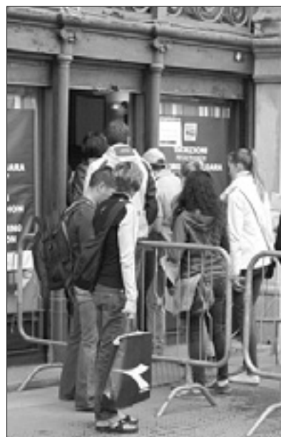
Vrsta za vpisovanje na Velikem trgu