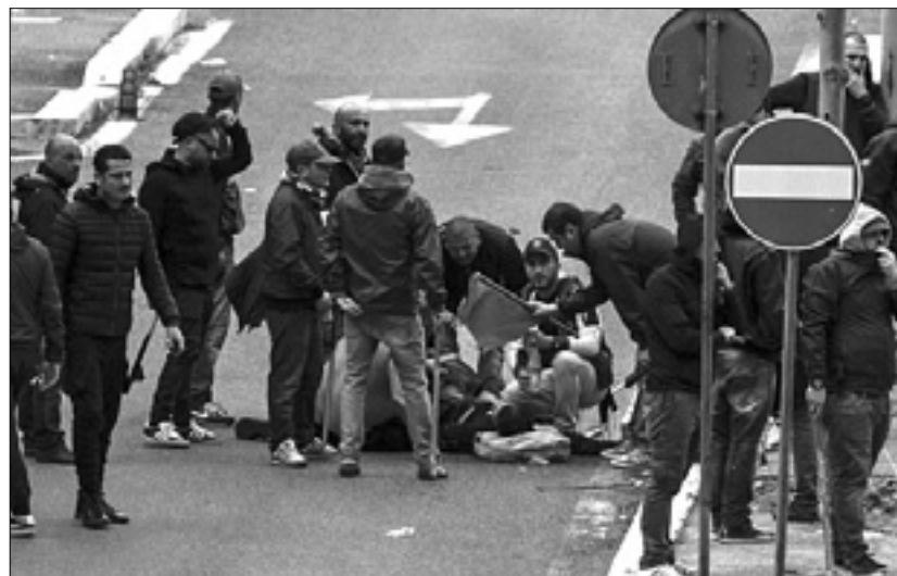
Prva pomoč enemu od ranjencev ANSA

V življenjski nevarnosti 30-letni Neapelčan - Spopadi z navijači Rome - Kvestura: Drugačni razlogi