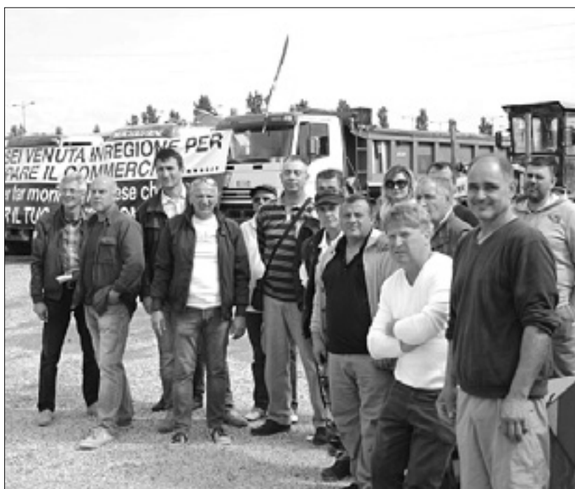
Protestniki so pred center Tiare prišli s transparentom in tovornimi vozili BUMBACA

Iz družbe VSC, ki je lastnik centra Tiare, so že večkrat sporočili, da nimajo nikakršne odgovornosti. Pojasnili so, da so izpolni-