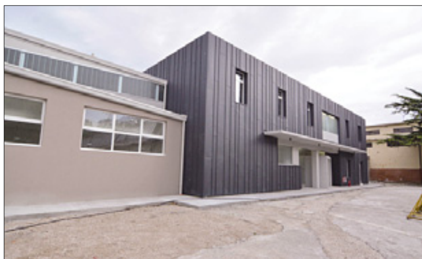
Mestni vojni muzej za mir bodo slovesno odprli 18. junija