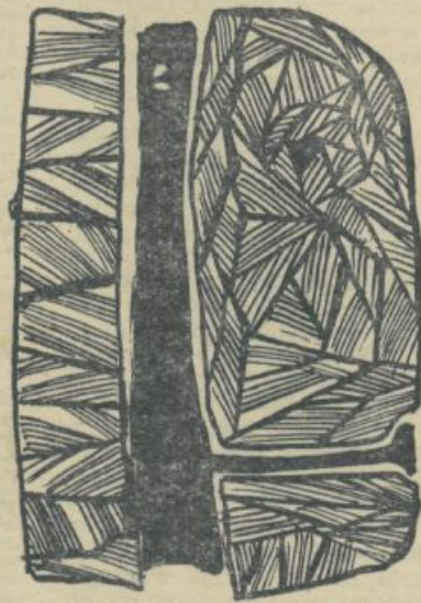
Anton Bivol: Vinjeta