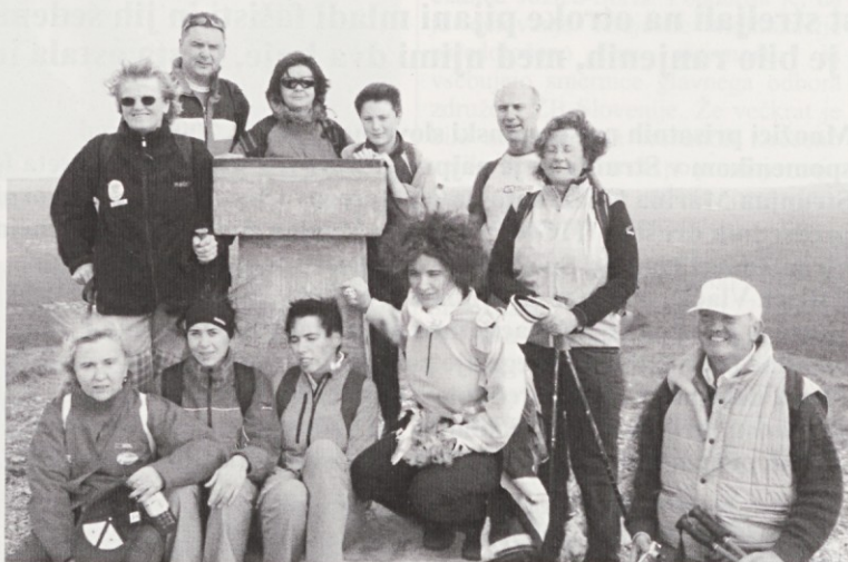
Na vrhu Slavnika.

POHODNIŠKA POT - SLAVNIK se uvršča med enodnevne pohodniške izlete, lažje kategorije in je prijavljen na Avtorski agenciji Slovenije pod oznakami P-22/03 in P-15/08. Namenjen je hotelskim in drugim gostom na obali, ki želijo svoje počitnice preživeti aktivno, raznoliko in v povezavi z naravo. Primeren je tudi za enodnevne izletnike oz. pohodnike iz notranjosti. Skratka pripravljen je za vse, ki radi naredijo nekaj zase, ki uživajo v svežem gorskem zraku in objemu vetra, ki