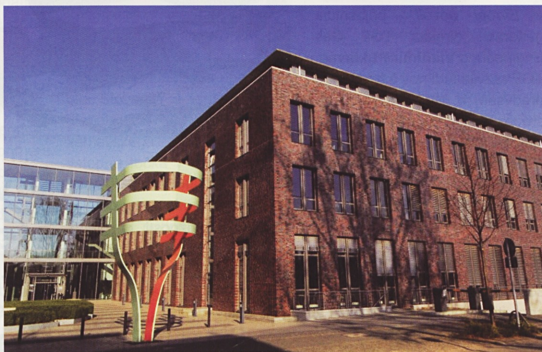
Upravno poslovna stavba v Bonnu.

Družba TGE je specializirana za razvoj projektov, inženiring, nabavo in gradnjo objektov na področju oskrbe s plini. Njeno delovanje je funkcionalno razdeljeno tudi na dejavnosti, ki se nanašajo na prevoz utekočinjenih plinov. Sem sodi tudi načrtovanje in izvedba celotne plinske tehnike tankerjev za prevoz utekočinjenega zemeljskega plina ter dejavnosti na obalnem območju, kakor tudi načrtovanje in izvedba sprejemnih in izvoznih terminalov, gradnja rezervoarjev za skladiščenje utekočinjenih plinov ter gradnja objektov za uplinjanje in odpremo plina. To pomeni, da TGE obvladuje procesne in logistične rešitve v