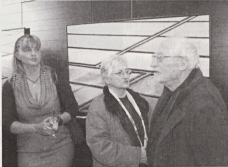
Obiskovalci razstave v Galeriji Banke Koper, 27. 2. 2009, v organizaciji Obalnih galerij Piran.