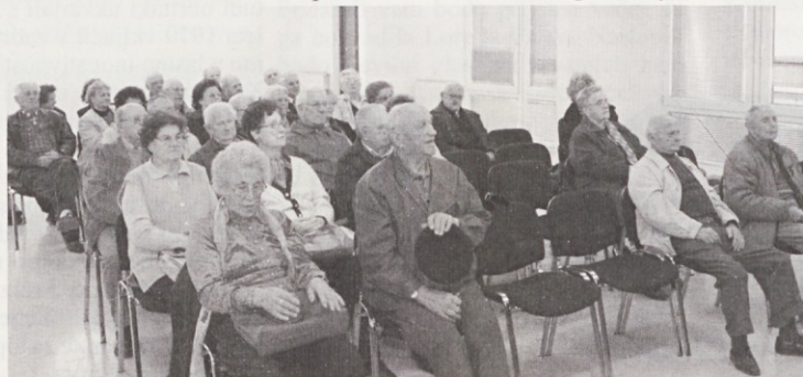
Zbor članov Krajevne organizacije ZB za vrednote NOB Lucija, 13. 3. 2009.