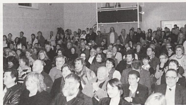
Nabito polna dvorana na prireditvi ob kulturnem prazniku v Sv. Petru, 13. februarja 2009.