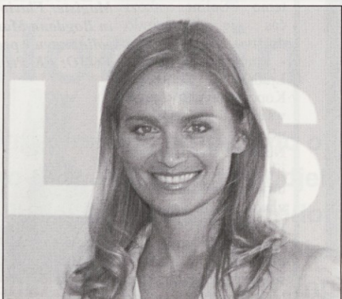
Ministrica Katarina Kresal

Na državljanstvo je vezanih veliko manj osnovnih človekovih pravic kakor na stalno prebivališče. Državljanji volijo in so lahko izvoljeni. Vsi tisti, ki imajo stalno prebivališče v konkretni državi, pa lahko delajo, poslujejo, kupujejo nepremičnine, dobijo vse državne dokumente - od voznškega dovoljenja do potnega lista... Morda so med izbrisanimi