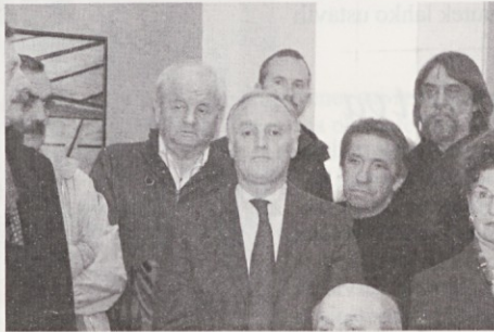
Obiskovalci razstave v Galeriji Banke Koper, 27. 2. 2009, v organizaciji Obalnih galerij Piran.