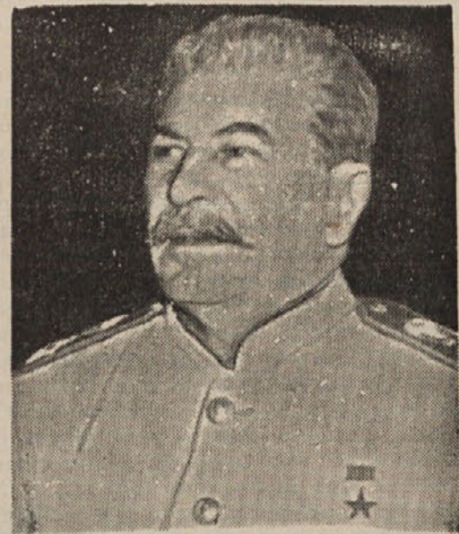
Jožef Viserjanovič Stalin 1879 – 5. 3. 1953

Vsi preganjalci Kristusove Cerkvu so šli v grob, brez upanja v vstajenje. Eden naj-silnejših je šel to pot ravno pretekle dni. Sveti Oče pa je molil za njegovo dušo. Naj bi ta molitev doprinesla naslednikom umrlega diktatorja luč spoznanja, da neomajno drži in stoji resnica božje besede: „Vrata peklena se ne bodo premagala!“