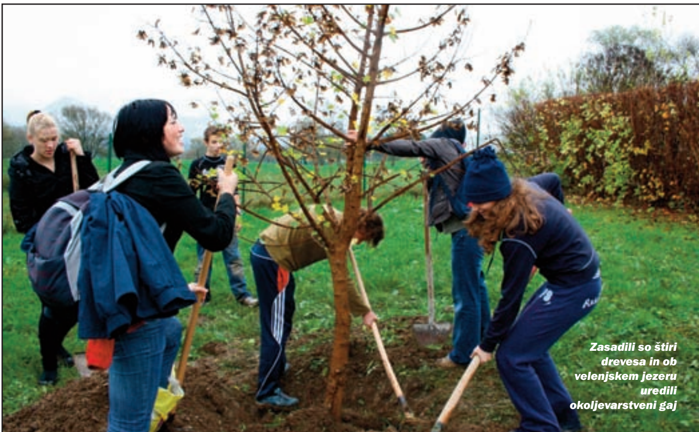
Zasadili so štiri drevesa in ob velenjskem jezeru uredili okoljevarstveni gaj