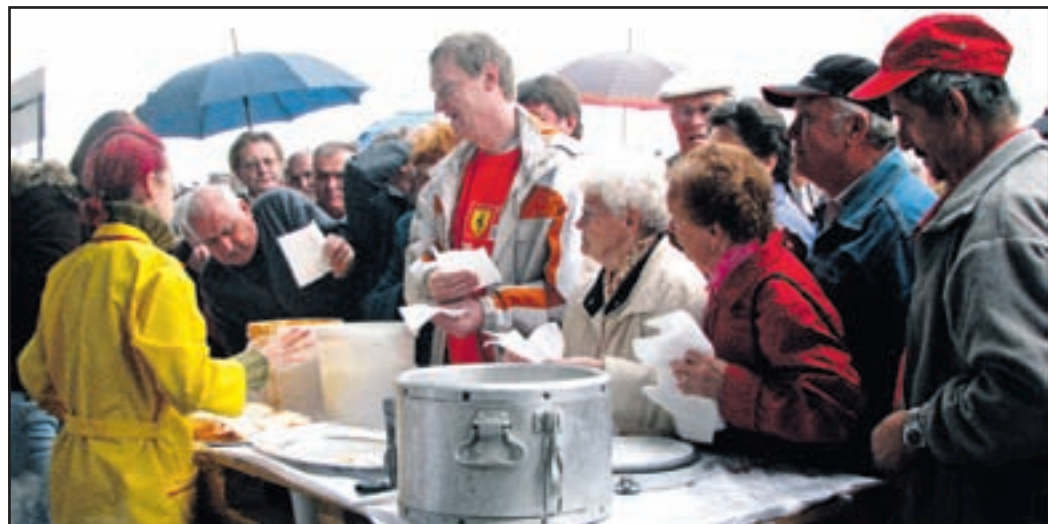
Obiskovalce so tudip ogostili.

Otvoritvenega dogodka, ki so ga popestrili z zabavo in pogostitvijo, se je udeležila množica ljudi. Podjetje Jagros, d. o. o., pa je ob tej priložnosti Osnovni šoli Gustava Šilaha in Vrtnu Velenje poklonilo po 500 evrov.