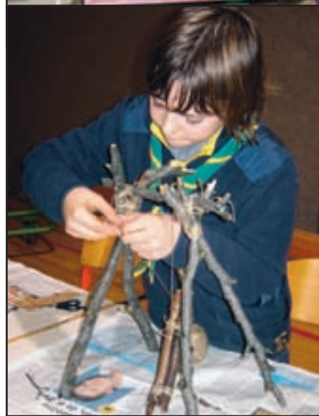
Bodoči taborniški arhitekt

Ob vseh temah smo se zraven tudi sproščeno pogovarjali in ob kakšnih idejah tudi od srca nasmejali. Vsi pa smo bili tako kot se za prave tabornike spodobi, oblečeni v kroje in okoli vratu imeli rutice.