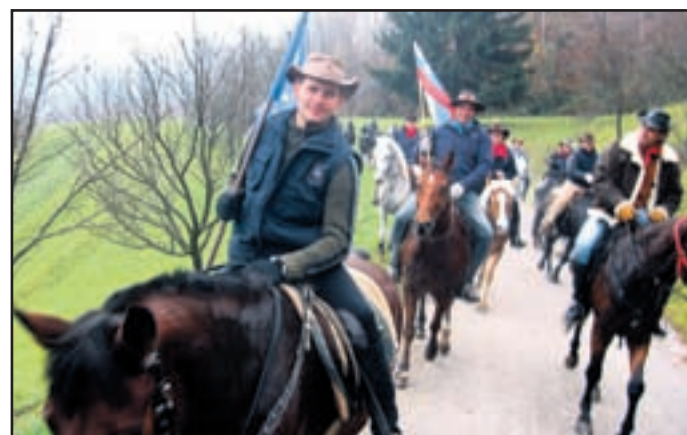
St radicionalnega pohoda konjenice

Na približno 20 kilometrov dolgo pot se je podalo 30 konjenikov, poleg članov domačega konjerejskega društva še predstavniki Malteške konjenice s Polzele, Mustanga Gomilsko, Zgornjesavinjskega konjerejskega društva Mozirje in Šaleške konjenice iz Velenja.