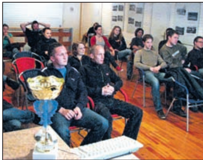
Ss kupščine vp rostoring alerije Dile