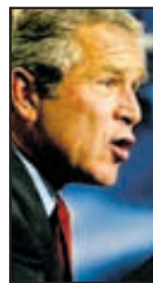
Po osmih letih vladanja, pride na vrsto obžalovanje.

V prvem intervjuju po izvolitvi Baracka Obame za novega predsednika ZDA je Bush spregovoril za ameriško televizijsko mrežo CNN in pokazal obžalovanje zaradi nepremišljenih izjav, ki jih je izrekel v svojem osemletnem mandatu. Med drugim Bush obžaluje, da je izrekel besede, da bodo vodjo Al Kaida Osama bin Lada ujeli mrtvega ali živega, kot je včasih pisalo na tiralicah na Divjem zahodu. Žal mu je tudi sporočila upornikom v Iraku, naj le pridejo na plano in napadejo, če si upajo.