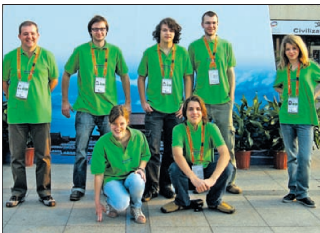
Slovenskib ridžisti vP ekingu

»Tekmovanje je potekalo po švicarskem sistemu, tako da je reprezentanca vsak dan odigrala tri dvoboje, v vsakem dvoboju pa 16 iger. Psihično naporno moštveno tekmovanje, saj so bili mladi igralci vsak dan izpostavljeni sedemurni miselni obremenitvi, je zahtevalo davek. Vsako pomanjkanje zbravnosti in koncentracije je pomenilo vzetek manj, ki je odločal o porazu ali zmagi v dvoboju,« je po vrnitvi