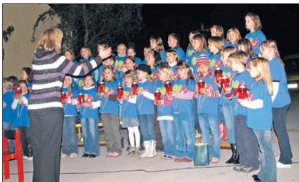
Prisrčen program sopripravili čenci.

»Ta cesta vsak dan zahteva posebno previdnost vseh udeležencev v prometu, kajti to je cesta, na kateri je težko določiti črne točke, ker je nevarna v vsej svoji dolžini. Po njej bomo morali strpno voziti tudi v prihodnje, ker hitre ceste še nekaj časa ne bo. Potrebno pa je napraviti vse, da jo dobimo čim prej. Želim si, da bi ljudje dojel, da je v prometu predvsem potrebno drugačno obnašanje, da je vsako hitenje