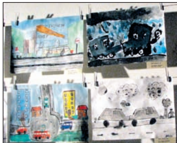
Risbe na temo prometne varnosti so bilez govorne.