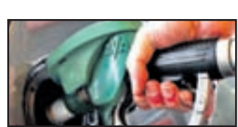
Cene nafte še navzdol.

cenejši po februarju 2007, v začetku julija letos pa je doživel svojo najvišjo vrednost, ko je bilo treba za liter odšteti 1,217 evra.