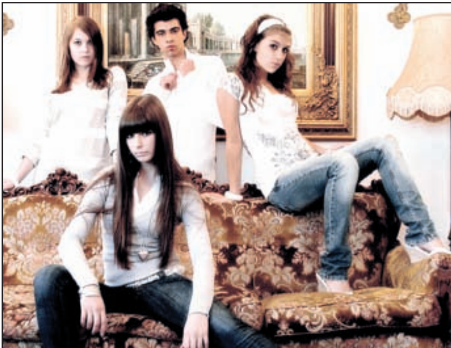
Wild step