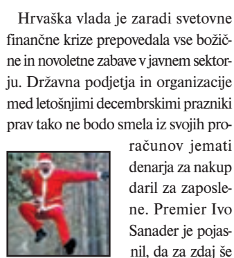
Na Hrvaškem letos ne bo božička.

Zaradi pomanjkanja naročil bodo v Savi Tires, hčerinskem podjetju koncerna Goodyear, letos že četrčič začasno ustavili proizvodnjo. Gre za enega od ukrepov, s katerimi se v podjetju odzivajo na krizo in prilagajajo razmeram na trgu. Kot pojasnjujejo, težave v finančnem sistemu močno vplivajo tudi na avtomobilsko industrijo, zaradi česar je tudi povpraševanje po pnevmatikah manjše.