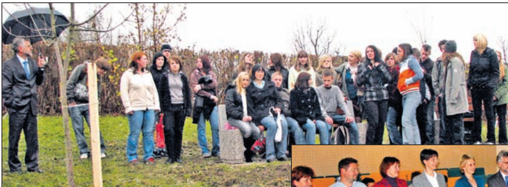
Prva generacija koljevarstvenikovP oklicne in tehniške šole jes estavila tudi svojo: Ne bodib udalo, pazi nan aravo.

Na Poklicni in tehniški rudarski šoli na poseben način zaznamovali začetek izobraževanja v novem programu okoljevarstveni tehnik - Na šoli prvič po 50 letih več deklet kot fantov - Zaobljuba sebi, okolju in planetu Zemlja