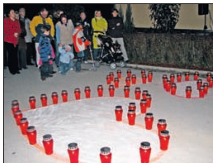
Svečke za žrtve prometnih nesreč.