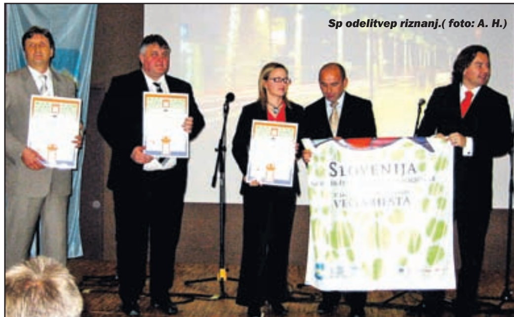
Spodelitve priznanj.