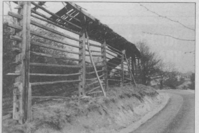
Tihožitje starega kozolca ob prenovljeni in asfaltirani cesti na Volavljah.

Občnem zboru sta prisostvovala in ga pozdravila tudi v.d. predsednik občinske skupščine gospod Celestina in