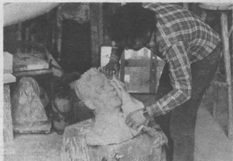
Naša kamera je posnela nastanek zadnjega osnutka portreta Edvarda Kardelja, za katerega trdi kipar, da je najboljši.

Kardeljeva vodilna vloga v njem in mislim, da se mi je to kar dobro posrečilo. V celotni skulpturi bo realističen samo Kardeljev lik, vsi ostali liki so skicirani. Seveda sem poleg vsega upošteval tudi prostor, kjer bo stal spomenik, namreč na Trgu revolucije. Nova skulptura bo stala na tleh, brez podstavka, in vsi liki bodo enake velikosti. Z razdalje dvajsetih metrov bodo postave videti v naravni velikosti.