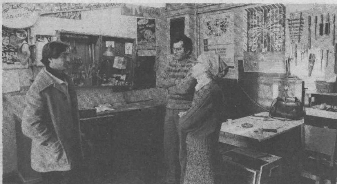
Sedanji prostori delavnice LGL v "cukrarni" na Povšetovi.