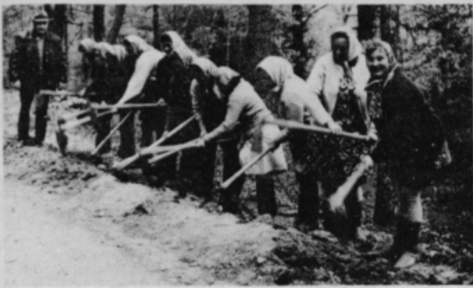
Pri gradnji vodovoda žene in gospodinje niso zaostajale.