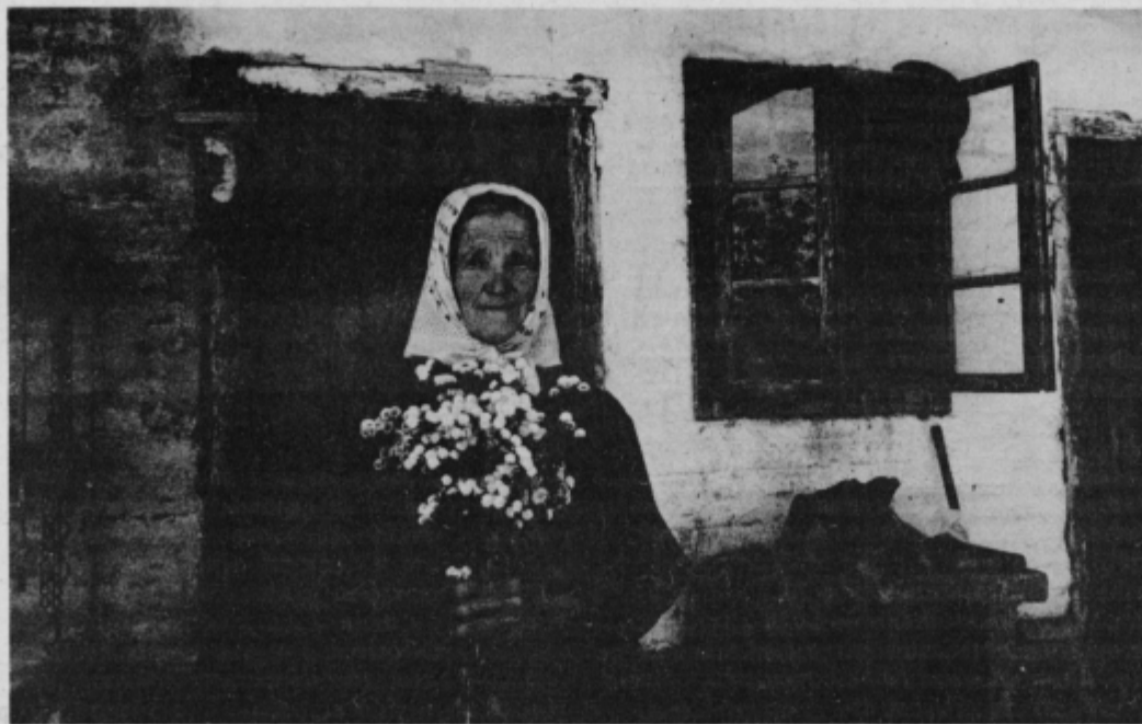
S lika: Spomnimo se tudi tistih, ki težko živijo v samoti in revščini

uveljavljanju družbenega položaja ženske? Ta dan je tudi priložnost, da opozorimo na probleme in vprašanja, ki so pred našo družbo, ter da predlagamo tudi poti in sredstva za njihovo reševanje, da spodbudimo aktivnost skozi vse