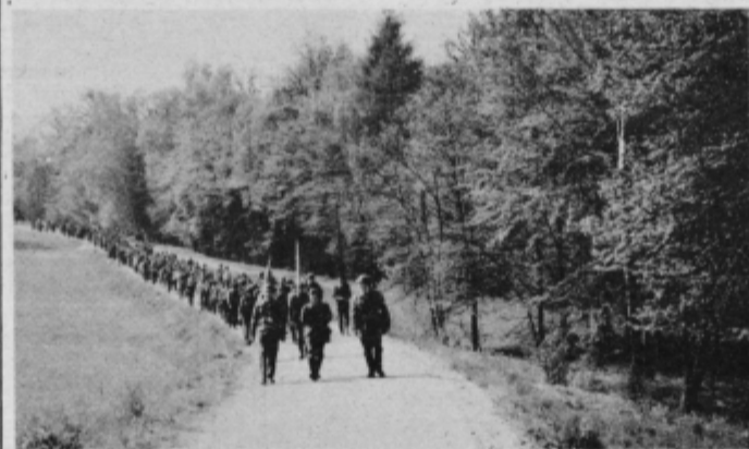
Enota teritorialne obrambe na pohodu

ustrezne ljudi, ki bodo vodili štabe v krajevnih skupnostih. Skladno s tem bo potrebno pripraviti tudi vojne načrte za vsako krajevno skupnost, vanje vgraditi specifičnosti vsake KD in jih z operativno evidenco sproti dopolnjevati. Vojni načrt praktično ne more biti nikoli dograjen, saj ga je treba stalno ažurirati, dopolnjevati in prilagajati