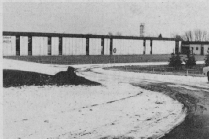
Novi poslovni prostori Delte. V njih dosega za 30 odstotkov večjo storilnost.