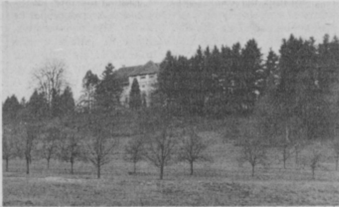
Idilični grad Štatenberg z okoljem v turizmu neizkoriščen objekt.