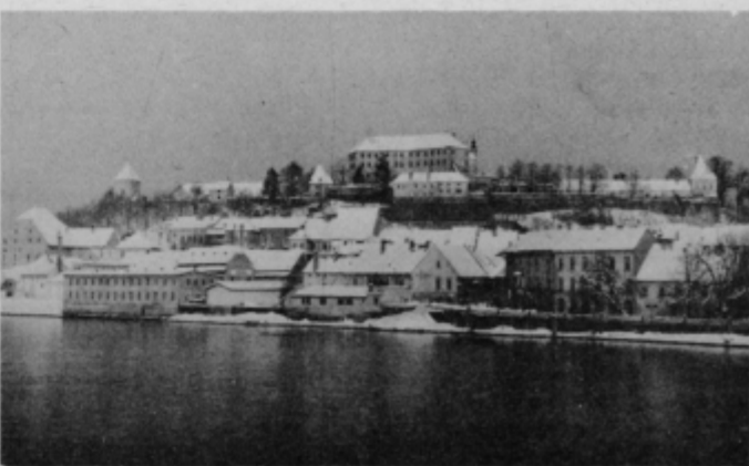
Ptuj le za nekaj dni pod snežno odejo

Kruta je realnost, da čvrsto, premočno stojimo na braniku svoje domovine, in da so nezrele tiste kalkulacije zahodne evropskih kapitalističnih sil, ki še vselej računajo, da je moč krmilo jugoslovanskega socializma zaobrtni k tistemu, kar smo že preživeli in okusili na svojih ramenih. Vsak zase in vsi skupaj smo dolžni, da branimo sleherno ped svoje zemlje, in da ne dovoljujemo, da bi ustaši, četniki in drugi prevratniki morili naše najboljše sinove. Zato ponovno zahtevamo od Zveznega sekretariata za zunanje zadeve, da najodločneje posreduje pri uradnih predstavnikih ZR Nemčije, da store vse, za dokončno onemogočitev dela ostankov fašističnih elementov, ki najdejo najugodnejša tla svojega delovanja prav v njihovi državi.