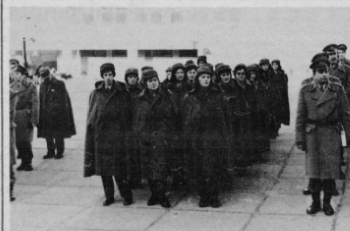
Teritorialke, na mestu — odmor!