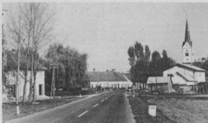
Lovrenc danes, levo zgradba z gasilskim domom.