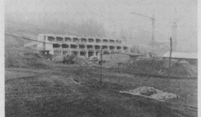
Motel v gradnji. Tudi po svoji posebni arhitekturi bo za marsikoga privlačen...