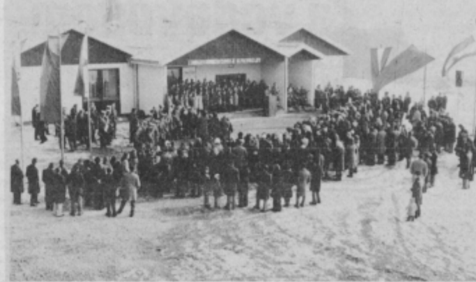
Nova šola Vinka Jurančiča v Vitomarcih