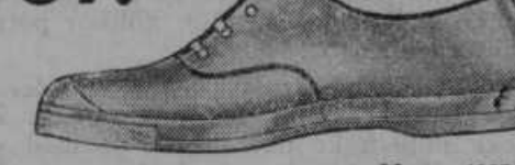
Vrsta 4337-25 Specijalni platneni čevlji za tenis z izvanredno močnim gumijastim podplatom. Izdelani po navodilih najboljših teniš igralcev.