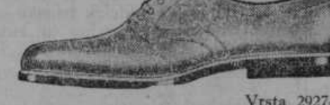
Vrsta 2927-15 Okusni moški polčevlji iz rjavega ali črnega boksa z močnim usnjatim podplatom. Udobna oblika daje čevlju posebno eleganco.

Pri nas dobite dobre in cenene nogavice: Moške Din 5.—, otroške Din 7.—, ženske Din 19.—.