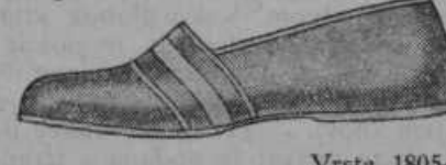
Vrsta 1805-61 Naši gumijasti kopalni čevlji Vas najbolj obvarujejo, ko hodite po razžarjenem pesku in ostrem kamenju. Lahki so in udobni.