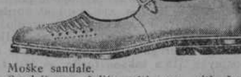
Moške sandale. Sandali ne žulijo niti nog niti žepa. Otroški št. 22-26 Din 39.—, št. 27-34 Din 49.—, ženski št. 35-38 Din 59.—, moški št. 39-46 Din 69.—