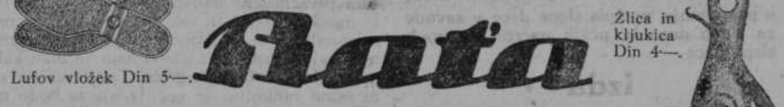
Lufov vložek Din 5.— Zlica in kljukica Din 4.—

Ni pravega poletnega počitka brez naše praktične obutve. V poletni vročini in soparnih dneh nosite lahko in zračno obutev. Vse naše prodajalne smo preskrbeli z bogatimi vzorci poletne obutve v raznih kombinacijah modernih barv. Naša obutev je cenena in dobre kvalitete.