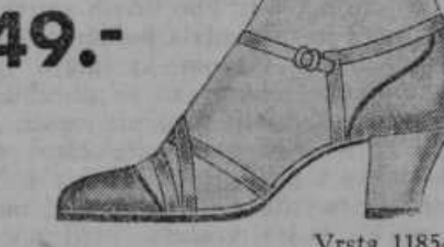
Vrsta 1185-36 Poleti v krasnih sončnih dnevih ne morete biti brez teh elegantnih čevljev. Imamo jih v vseh modernih barvah.