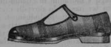
Za deklice. Vrsta 4762-74 Okusni platneni čevlji z belim gumijastim podplatom in peto, v nijansah raznih barv. K poletni obleki.