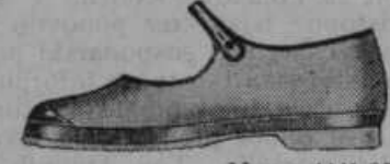
Vel. 19-26 Vrsta 4441-05 Za deco; Zračni in lahki platneni polčevlji okusne oblike, z gumijastim podplatom in peto.