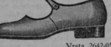
Vrsta 2642-05 Če ima otrok nove čevlje, je vedno vesel in razpoložen. Zato smo napravili te čevlje iz finega laka in rjavega boksa.