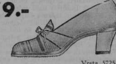
Vrsta 5725-77 Elegantni platneni pumps čevlji z gumijastim podplatom, v okusnih kombinacijah raznih barv. Oblika tega čevljička je vedno moderna.