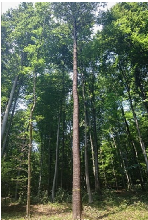
Slika 3: Plus drevo divje češnje iz GGE Ormož