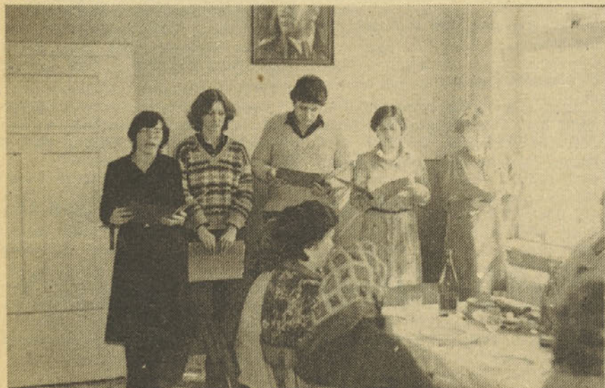
Za 8. marec se nam je na proslavi predstavila recitatorska skupina mladih. Dobro so se odrezali!

Pred prireditvijo »Pokaži, kaj znaš!« pa je še nekaj drugih, za mlade pomembnih dogodkov, kot so na primer: sprejem zvezne štafete, dan mladosti in sprejem brigadirjev na Kozjanskem. Zato – mladinke in mladinci – ne oklevajte! Sprejmite ta poziv resno, saj tisti, ki smo zadolženi za kulturne prireditve, pričakujemo vaš odziv in vaše sodelovanje!