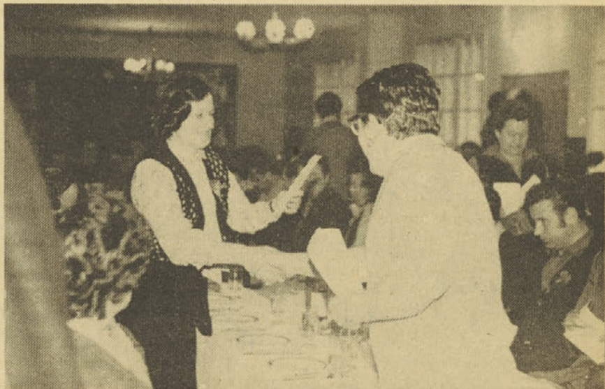
Čestitka jubilarntki za dvajsetletno delovno dobo...