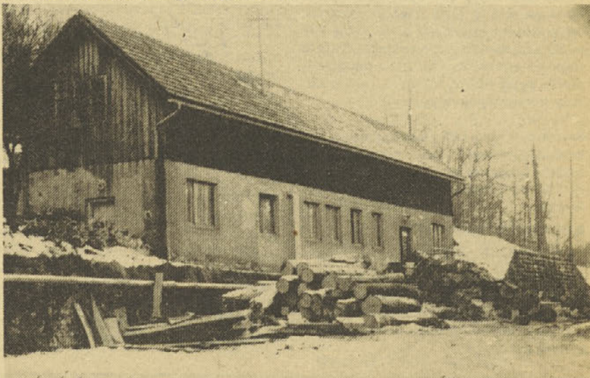
Zaenkrat še dovolj na zalogi

Tako postavljeni smoter tretjega kongresa samoupravljalcev Jugoslavije in aktualni družbenoekonomski in politični trenutek, v katerem pripravljamo kongres, opredeljujeta osrednjo temo kongresa: združeno delo v boju za socialistično samoupravljanje in za družbenoekonomski razvoj. V njenih okvirih bodo v središču pozornosti vprašanja, kot so: pridobivanje in delitev dohodka, samoupravno povezovanje in združevanje na dohodkovnih osnovah in združeni delavci v delegat-