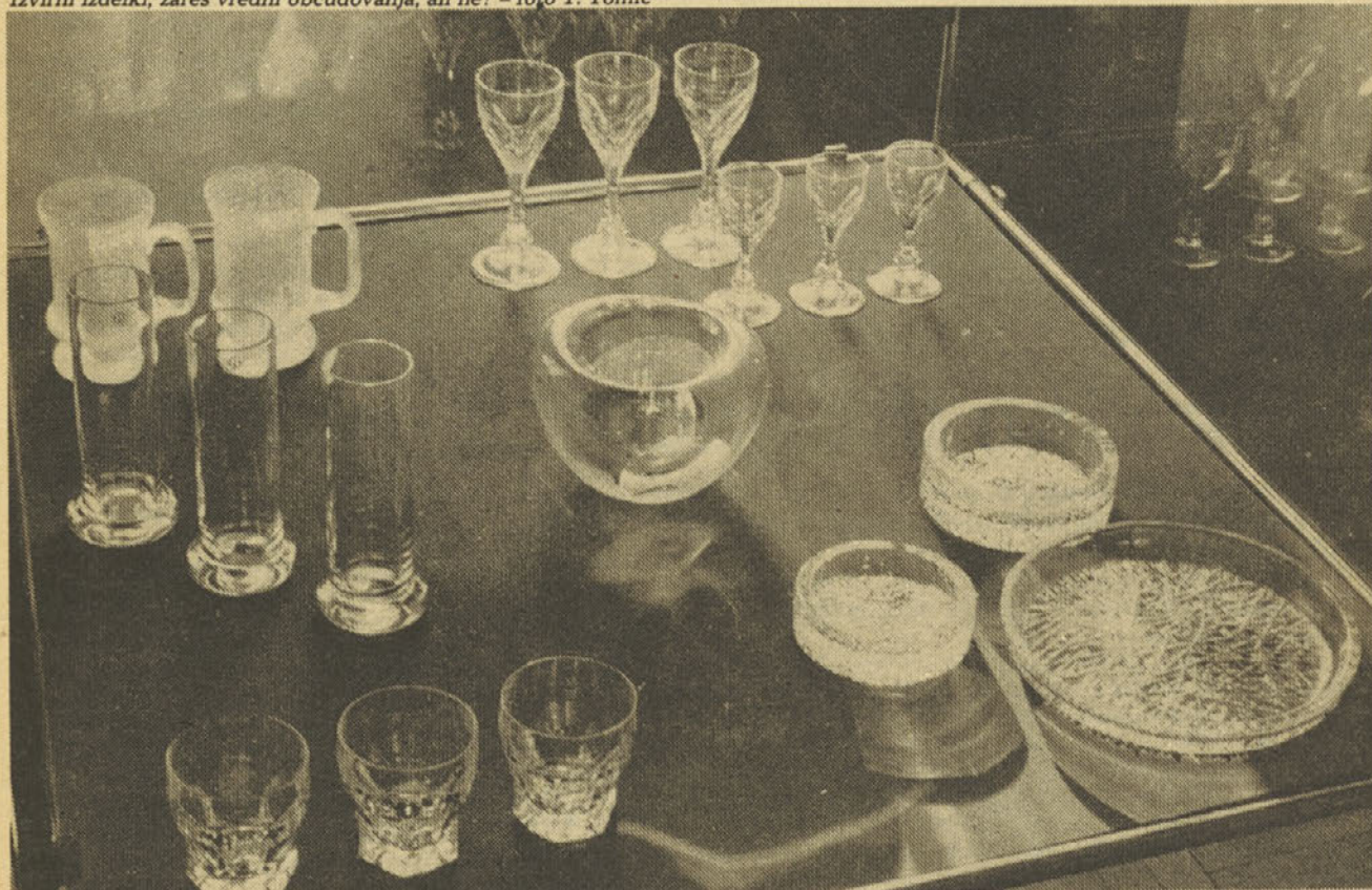
Izvirni izdelki, zares vredni občudovanja, ali ne?