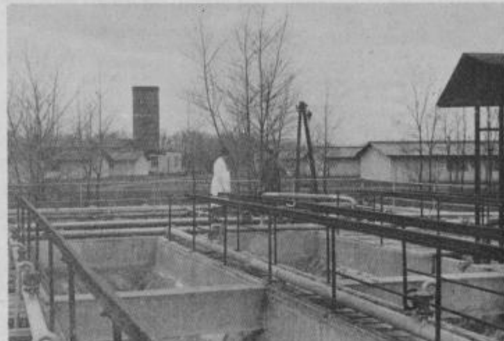
Prenovljene prečiščevalne naprave farme bekonov Turnišče, ki bodo pričele delovati že konec tega meseca.