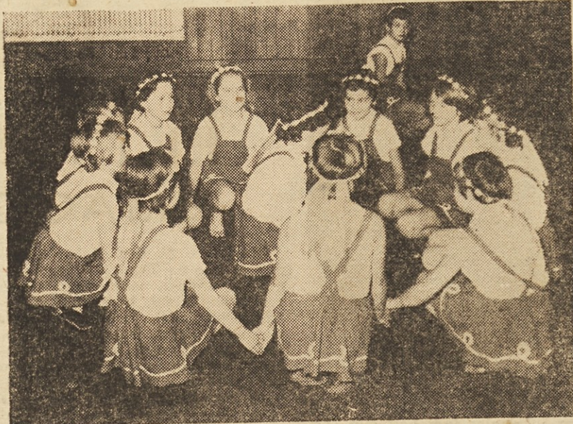
Zenski podmladek Partizana Vič na akademiji 23. t. m. med izvajanjem točke »Naša četica koraka«

Neko ameriško sodišče je sklenilo, da mora bivši svetovni boksarski prvak težke kategorije Šved Johansson, plačati ZDA še milijon dolarjev na zaostalih davkih.