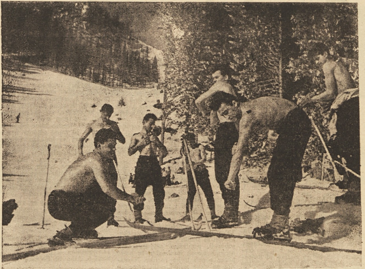
Sport je v JLA ena izmed najpomembnejših oblik razvedrila. To nam dokazuje tudi naša fotografija, posneta na smučarskih terenih, ko so vojaki pripeli smuči in se predali snegu in zimskemu soncu ter se naužili mnogo zimskega veselja. Pri tem seveda niso pozabili, da je smučanje izredno koristno tudi pri nalogah, ki jih opravlja naša armada

Se nekaj nas prijetno preseneča. Zanimanje za hokej je vedno večje. Na Jesenicah je pod Mežakljo ob vsakem pomembnem srečanju več kot 3000 gledalcev. Danes pa, ko smo dobili umetno drsališče tudi v Ljubljani, postaja hokejska igra ena izmed najbolj priljubljenih panog med našim športnim občinstvom. Dokaz za to je prav srečanje Jesenice : Ljubljana, ko se je zbralo skoraj 7000 gledalcev, ki so ob koncu zadovoljni zapuščali ledeni stadion. Če je, torej, med mladino takšno zanimanje za določeno športno panogo, potem res ni težko izluščiti najboljše in sestaviti moštvo, ki bo kos tudi najtežjim nalogam. In to bo prej ali slej tudi v Ljubljani.