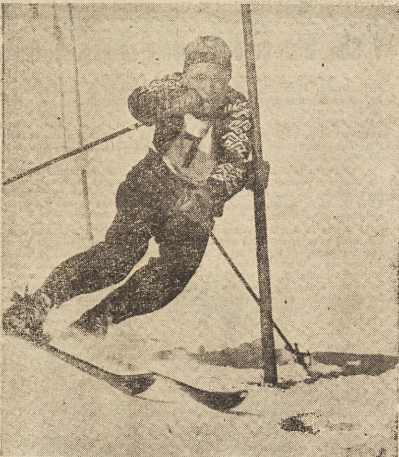
Anderl Molterer je bil lani najuspešnejši profesionalni smučar

V posameznih nogometnih prvenstvih je stanje ob vrhu lestvic naslednje: Svica — Servette 25, Lausanne 20, Chaux de Fonds in Grasshoppers po 18, Anglija — Burnley 30, Tottenham 27, Ipswich 27, West Ham 27, Avstrija — Austria 22, LASK 21, Rapid 17, Španija — Real 27, Atletico 25, Saragossa 21, Nemčija južna liga — Eintracht 28, Nürnberg 25, Offenbach 21, zahodna liga — Köln in Schalke po 25, Münster 24, jugozahodna liga — Pirmanses in Neukirchen po 29, Kaiserslautern 27 točk.