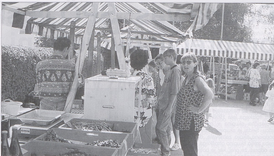
Kmečki trg v Borovljah je bil zelo velik uspeh. Zanimanje kupcev je bilo veliko, tako da so bili domači kmetje zadovoljni in bodo takšen prodajni sejem v prihodnje pogosteje prirejali.