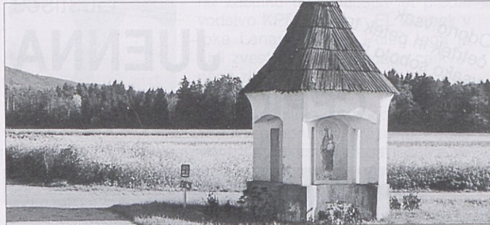
Polje, kdo bo tebe ljubil . . .