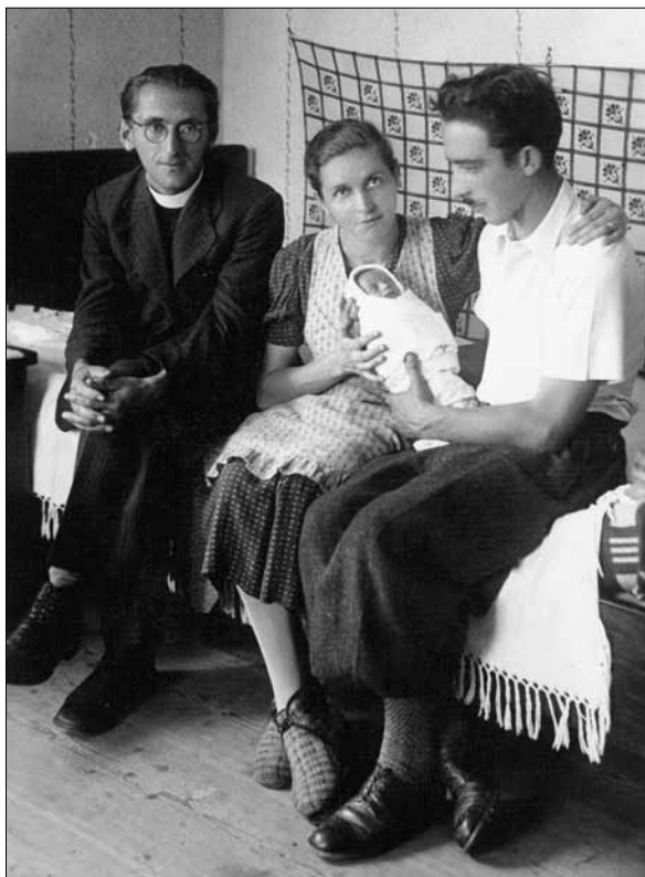
Spomin iz leta 1938. Hrani Muzej Velenje.

In res je prej kot čez dve leti (v noči z 22. na 23. maj 1969) umrl, star dobrih 66 let. Marca istega leta je napisal oporoko. V njej je izrazil svoje razočaranje tako nad cerkveno kot posvetno oblastjo. Poleg oporoke v tem sklopu dokumentov najdemo uradno poročilo o smrti, osmrtnice ter načrte za izdelavo nagrobnika, ki krasi njegov grob na ljubljanskih Žalah. Portretna figura Jožeta Lampreta ob prenosu ranjen-