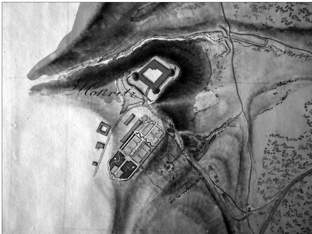
Detajl iz Žerovčevega načrta, ki prikazuje tlorisno ureditev gradu Mokrice z vrtom, okoli 1807 (SI AS 1068, Zbirka načrtov, 2/163).