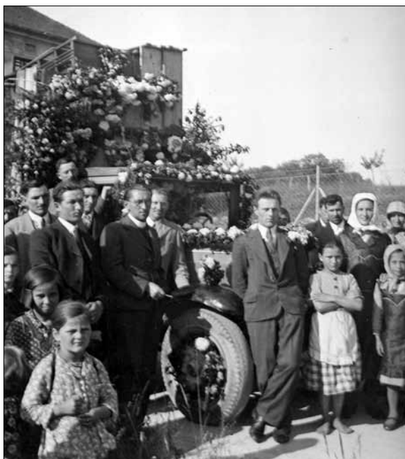
Posneto v Svetem Juriju v Slovenskih Goricah. Hrani Muzej Velenje.