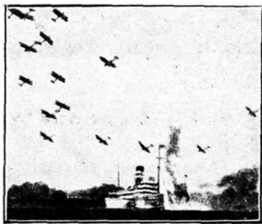
Velike vaje angleške mornarice. (Zrakoplovi obstreljujejo ladjo.)

nedostatek. Operater bo tičal v skritem opazovališču in stal pred kontrolno mizo. Pred seboj bo imel šest tabel, na katerih bo zapisano: vzhod, zahod, jug, gori, doli. Da-leč v deželo bodo izpustili letalo, polno