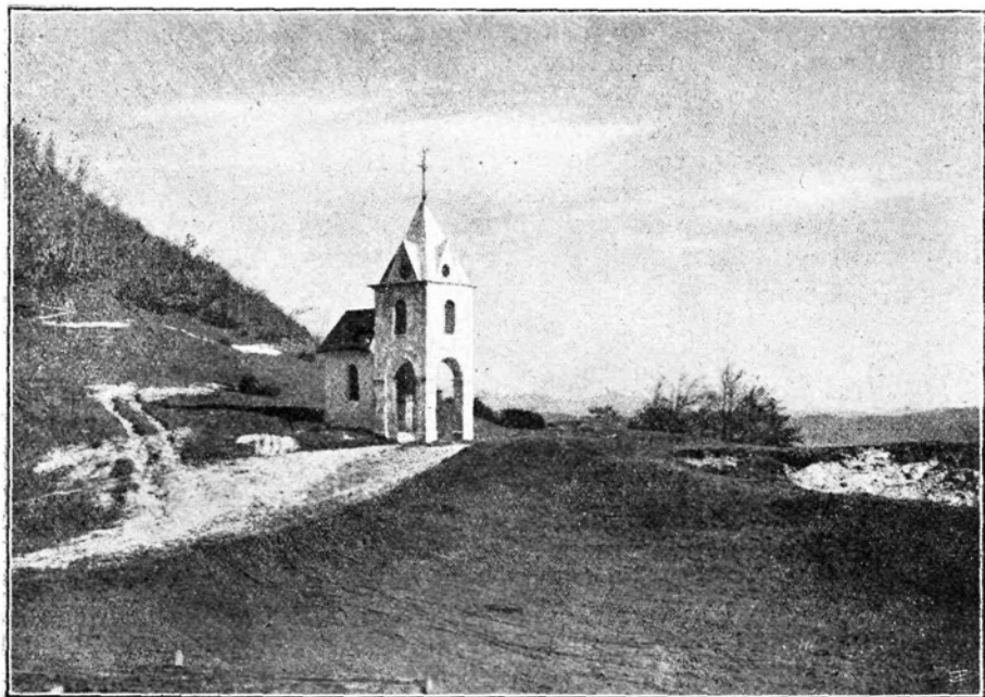
Kapelica nad Črnim vrhom.

»O, gospodar! Ničesar me ne poprašuj in ničesar ne želi zvedeti! Človek v telesu ne prenese resnice, resnica ubija ... Z Bogom! Moram že iti od tu.«