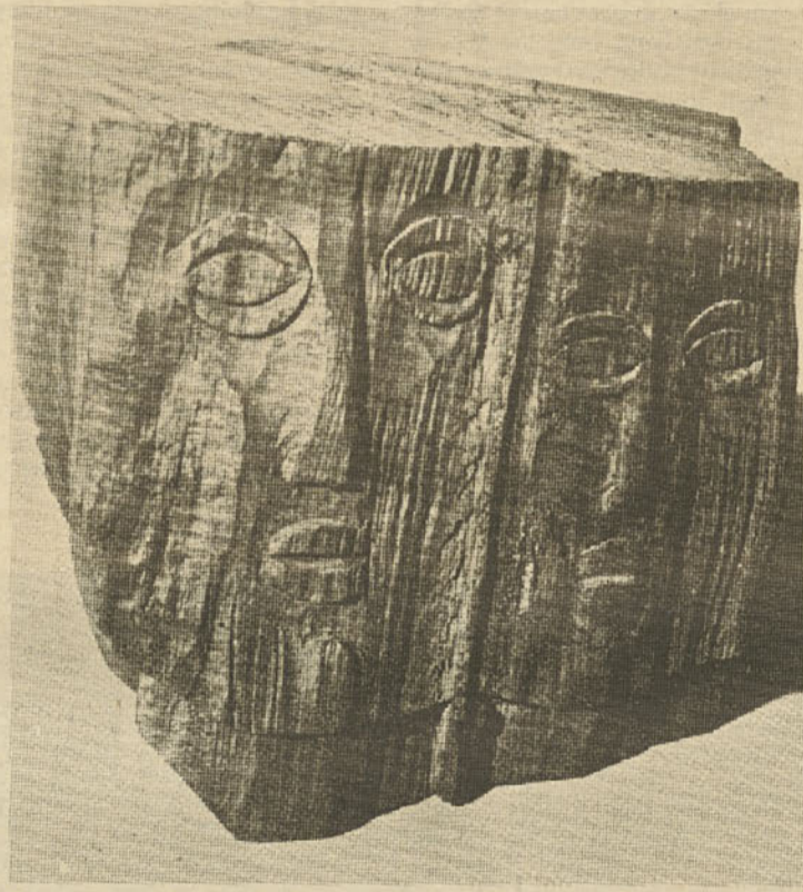
Dvojica, les, 1953