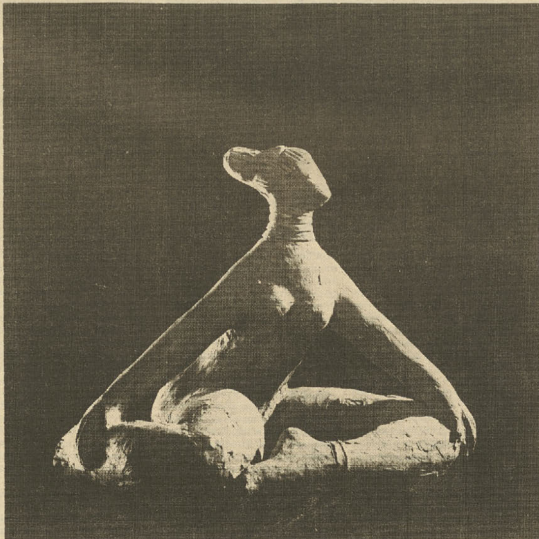
Vladimira Bratuž-Laka: Sedeča, žgana glina, 1954

Objavljamo nekaj del kiparke in arhitektke Bratuževe — reprodukcije so iz kataloga ob njeni retrospektivni razstavi, ki je bila v razstavišču Riharda Jakopiča v Ljubljani do 8. marca 1987.