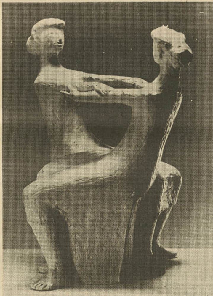
Prijateljci, žgana glina, 1954