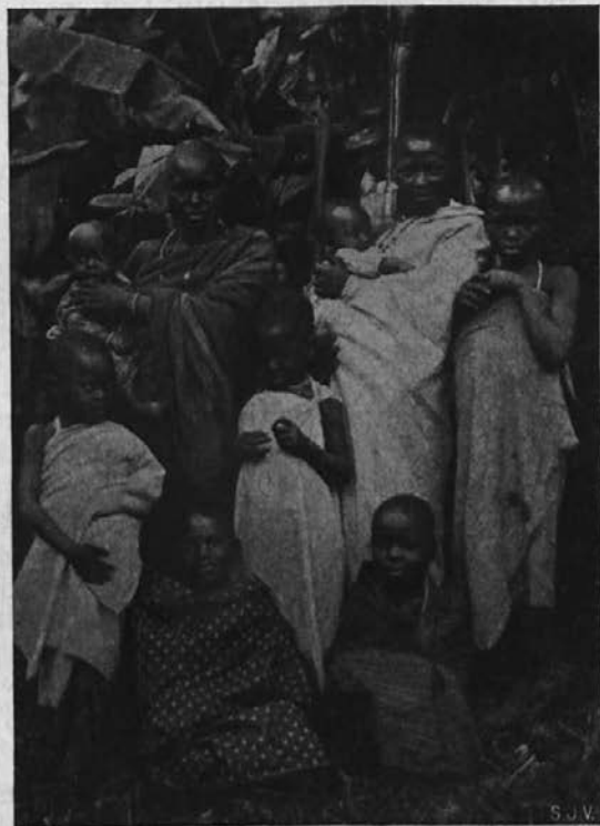
Krščanska zamorska družina.