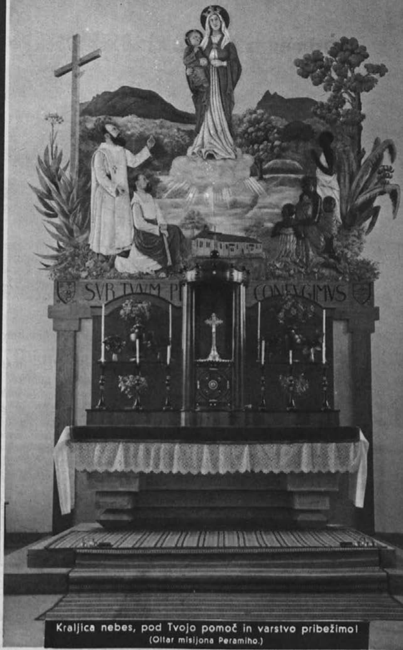
Kraljica nebes, pod Tvojo pomoč in varstvo pribežimol (Oltar misijona Peramiho.)