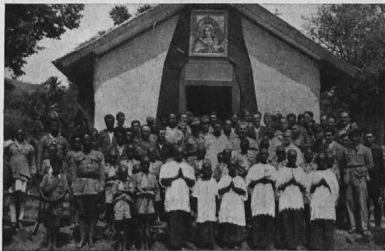
Zamorski kristjani pred misijonsko cerkvico.