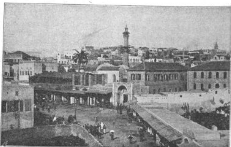
Jafa, sredi mesta.