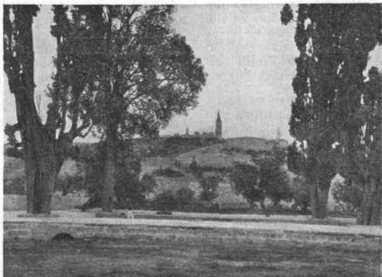
Oljska gora z ruskim stolpom.

Ta ravnina je menda zelo rodovitna. Takrat je bila skoro gola. Pomisliti je treba, da ni bilo dežja že pol leta. Kakšno bi bilo pri nas, ko bi pol leta ne bilo kaplje dežja! Kakor znano, sta tam samo dva poletna časa — poletje in zima — deževna in suha doba. Pač pa smo videli kakor v mestu Jafi tako še posebno tukaj izven mesta začuda veliko razne živine; cele čede ovac, kamel, in tudi goveje živine. Od česa le tolika množica živali živi, ko ni videti skoro nič zelenega, to mi je bila uganka. Menda jedo prst ali ka-