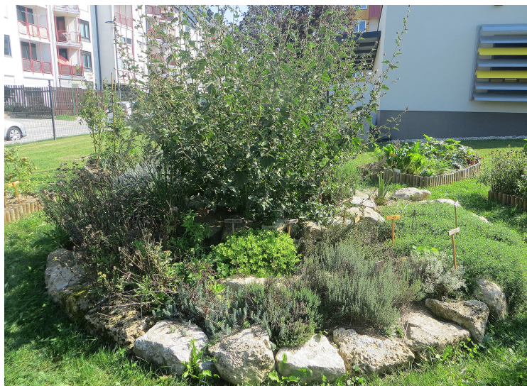
Zeliščna spiralna greda v poletnem razcvetu