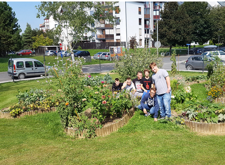
Zelenjavne gredice z mladimi vrtničkarji