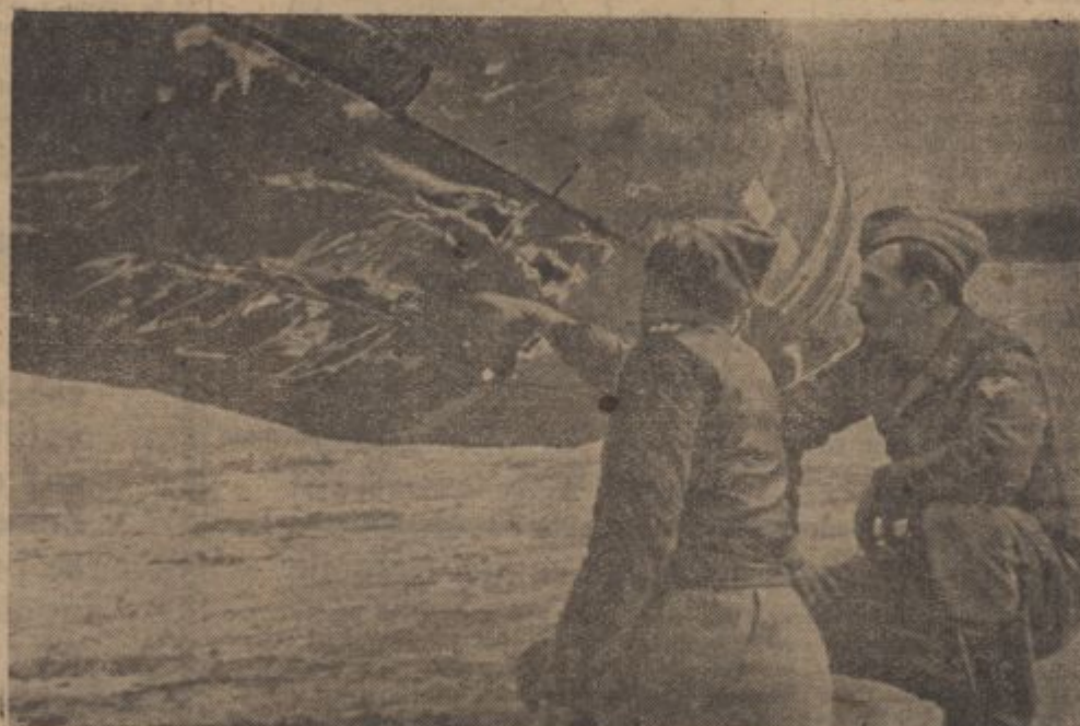
PK.-Kriegsbericht Jacobis PBZ (Sch.).

Potreba štednje se je najvidnejše pokazala v vprašanju financiranja vojne. Spričo zelo povišanih narodnih dohodkov so bili davčni dohodki Reich-a že v mirni dobi tako obsežni, da je bil bistveni del vojnih izdatkov zasiguran že na davčni strani. V sled nadaljnega porasta narodnih dohodkov in valed uvedbe vojnih doklad k dohodnini in h gotovim trošarinam, so davčni dohodki Reich-a medtem še bolj narasli. Skoro polovico celokupnih izdatkov Reich-a se krije in