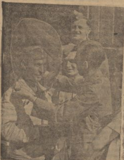
PK-Kriegsbericht Pfeiffer (Sch.)

× Japonska industrija na Borneu. Japonci si prizadevajo, da bi dvignili industrijo otoka Borneo, ki so ga odvzeli Holandcem. Da bi se pridobivanje rudnin postavilo na širšo podlago, prevajajo delovne sile iz otoka Java na Borneo. Java je namreč prav gosto naseljena, medtem ko je na Borneu pomanjkanje delovnih rok. Rezen rudarjev potrebuje Borneo tudi veliko število gozdnih delavcev.