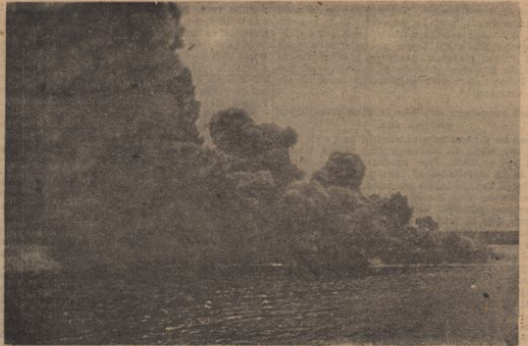
PK-Kriegsbericht Hirsche (PBZ — Sch.).

Brennendes Öl sperrt einen Hafen. — Heute Übung — morgen Ernstfall.