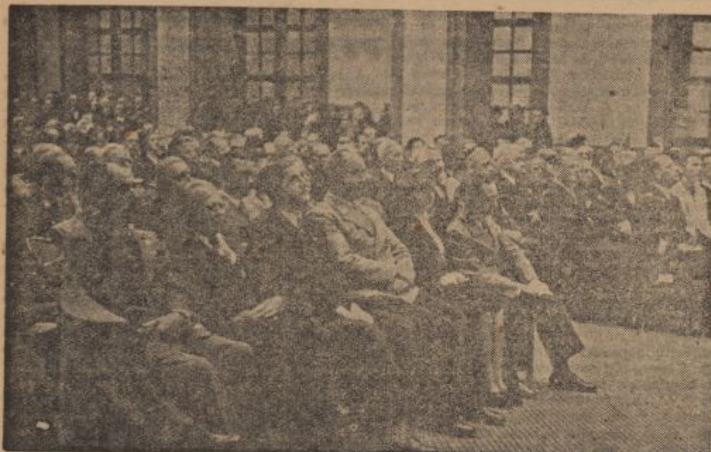
PK-Kriegsbericht Hirsche (PBZ. — Sch.).