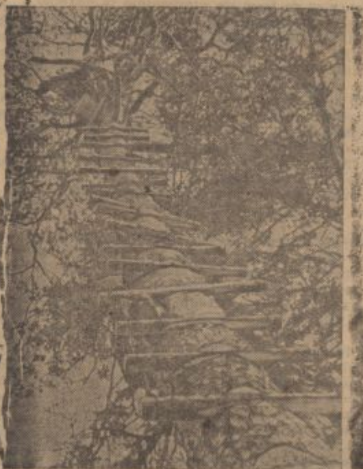
H-PK-Kriegsbericht Blaurock (PBZ — Sch).

Žitu najbolj nevarni pleveli so: osat, ljujka, pirnica, slak, grašice, škrobotec, njivski črnlec, kislica, preslica, gorčica, repica, njivski dresen,