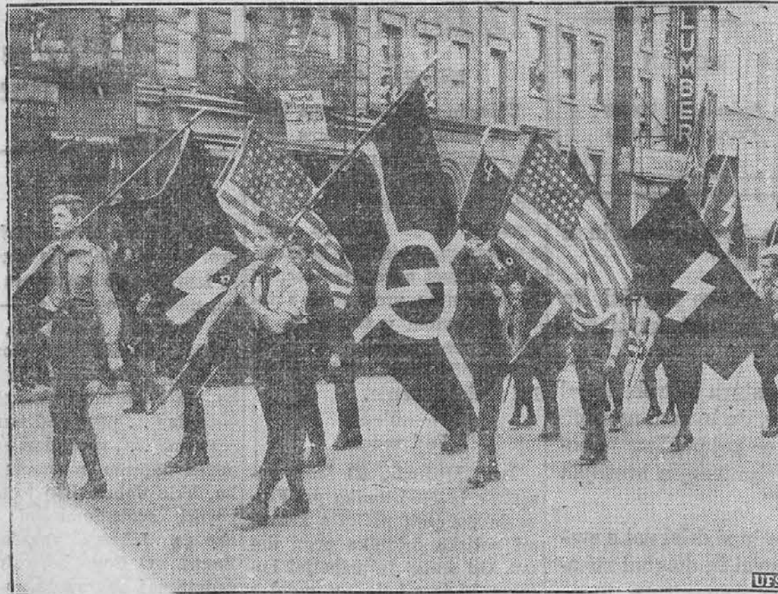
Nemci v Ameriki so ustanovili več zvez po nazijskem vzorcu in v katerih tudi vlada nazijski duh. Gornja slika kaže parado, ki jo je priredila nedavno taka zveza v New Yorku. Ameriške zastave so bile sicer v večini, vendar ni manjkalo tudi nazijskih znamenj.