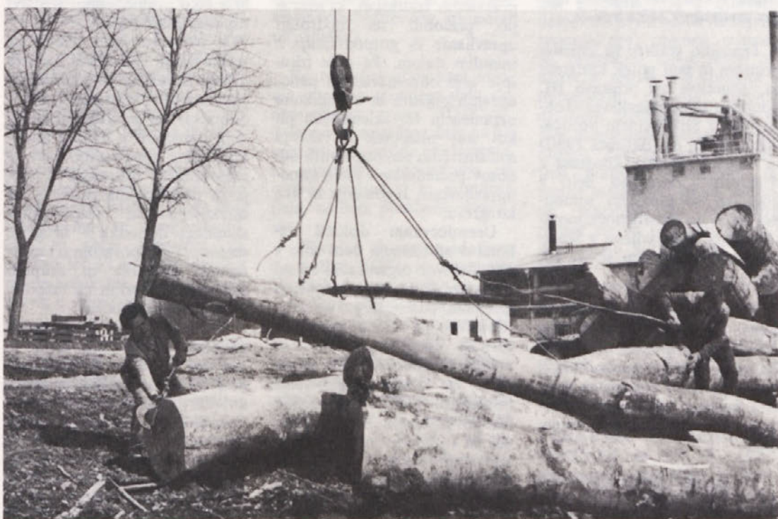
Dovoz bukove hlodovine je sedaj že kar normalen. Čeprav na skladišču v TOZD TVP ni večjih zalog, delavci le upajo, da se bo dovoz kaj kmalu povsem ustalil.