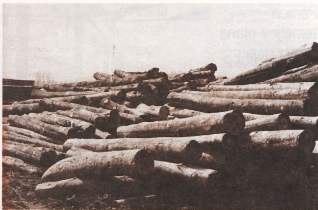
Tudi na skladišču v TOZD ŽAGA Straža se zaloge bukove hlodovine obetavno večajo. Posnetek je nastal 23. 3. 1981.

Problemi, s katerimi smo se srečevali v toku uvajanja in še srečujemo ob dograjevanju