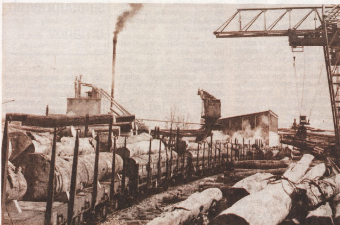
Tovorni vagoni, naloženi s hlodovino iz Afrike, so v tem času prav gotovo dobrodošla pošiljka za Novoles. Posnetek je nastal 23. 3. 1981.

V Novolesu smo že vajeni vgrajevati k planu dodatne ukrepe (posebno velja to za nekatera kritična gospodarska leta v preteklih obdobjih), redno delamo to že kar pol desetletja, letos pa smo se bili primorani še posebej potruditi, da bi bili dovolj pripravljeni ukrepati na vseh nivojih pravočasno in si tako prigrisati potreben dohodek. Želimo, da bi bila bilanca ob koncu leta 1981 podobna kot je bila leta 1980. Prepričani smo, da danes vemo že vsi, da je razporejanje odvisno le od realno ustvarjenega dohodka za vse tiste namene, ki nam omogočajo boljši danes in jutri.