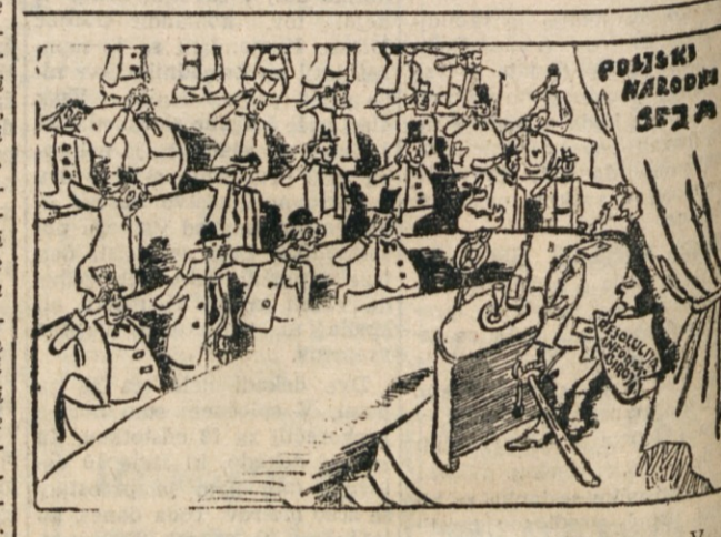
NASTOPNI GOVOR MARSALA ROKOSOVSKEGA V POLJSKEM PARLAMENTU (SEJMU): SEJM, MIRNO! NEMAS DA MRDAS, IMA DA SLUSAS!