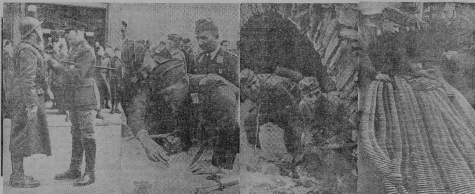
General Gort, vrhovni poveljnik angleških čet na Francoskem, odlikuje narednika za junaški čin