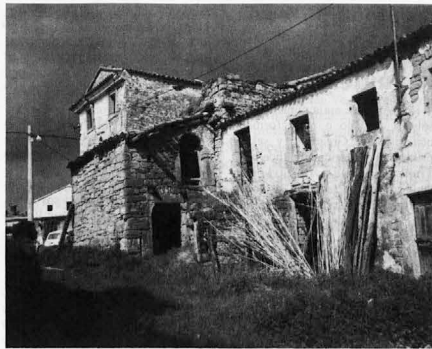
Motiv iz Labora

va ideja istrske avtonomije. Le-ta namreč postaja vse bolj očitena dejavnik destabilizacije polotoka, še zlasti spričo dejstva, da so se te opcije navdušeno oprijele prav vse vplivne skrajno desničarske in iredentistične sile na drugi strani meje, ker pač ocenjujejo, da za spreminjanje meja v tem trenutku ni prav nobenih izgledov. In ti mislijo s tem projektom skrajno resno ter ga nameravajo potiskati naprej tudi preko evropskih institucij, če se jim bo ponudila ugodna prilika. Hote ali nehote postaja tako IDZ njihov naravni zaveznik. In ravno okrog tega projekta je tudi prišlo v gibanju do prvega resnejšega razkola med jastrebi in umirjenjšimi regionalci. Razmerje moči zaenkrat še ni povsem jasno in s tem tudi ne izid spopada. Naj spomnemo, da se vse to odvija sočasno s številnimi, neravno prijaznimi dejavnostmi na drugi strani meje kot npr. razvpita kampanja Liste za Trst o »odkupu Istre«, ki nas obravnava kot vrečo krompirja, pa silovita in še vedno trajajoča propagandna vojna neofašistov in drugih desničarskih skrajnežev o nujnosti revizije Osima, pa razne kampanje o referendumih v zvezi z Istro, pa vse večje prijateljstvo Finijev, Gambassinijev, Agnelijev idr. s samodrško in krvavo beograjsko politično čaršijo in soldatesko in končno, zakaj ne tudi razni zagonetni uradni politični obiski v Beogradu (npr. Colombo idr.). Ne more biti npr. tudi nobeno naključje, da je dan po hrvaških volitvah ob-