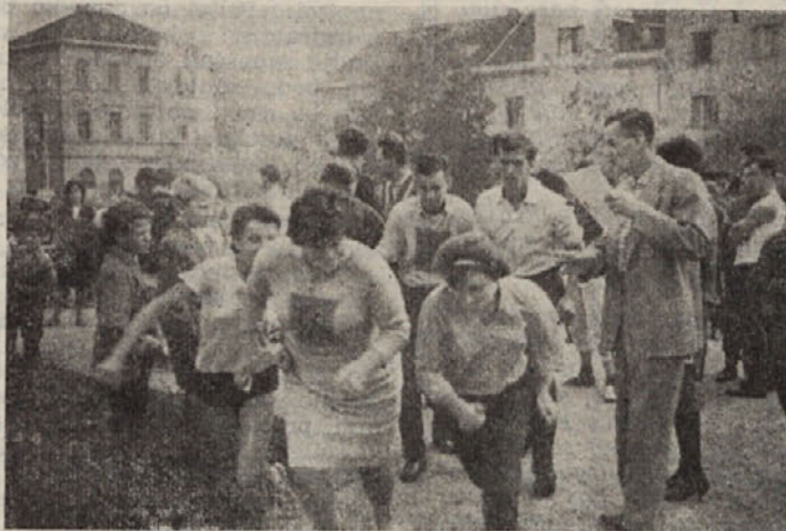
Mladina se pogosto udeležuje raznih športnih tekmovanj